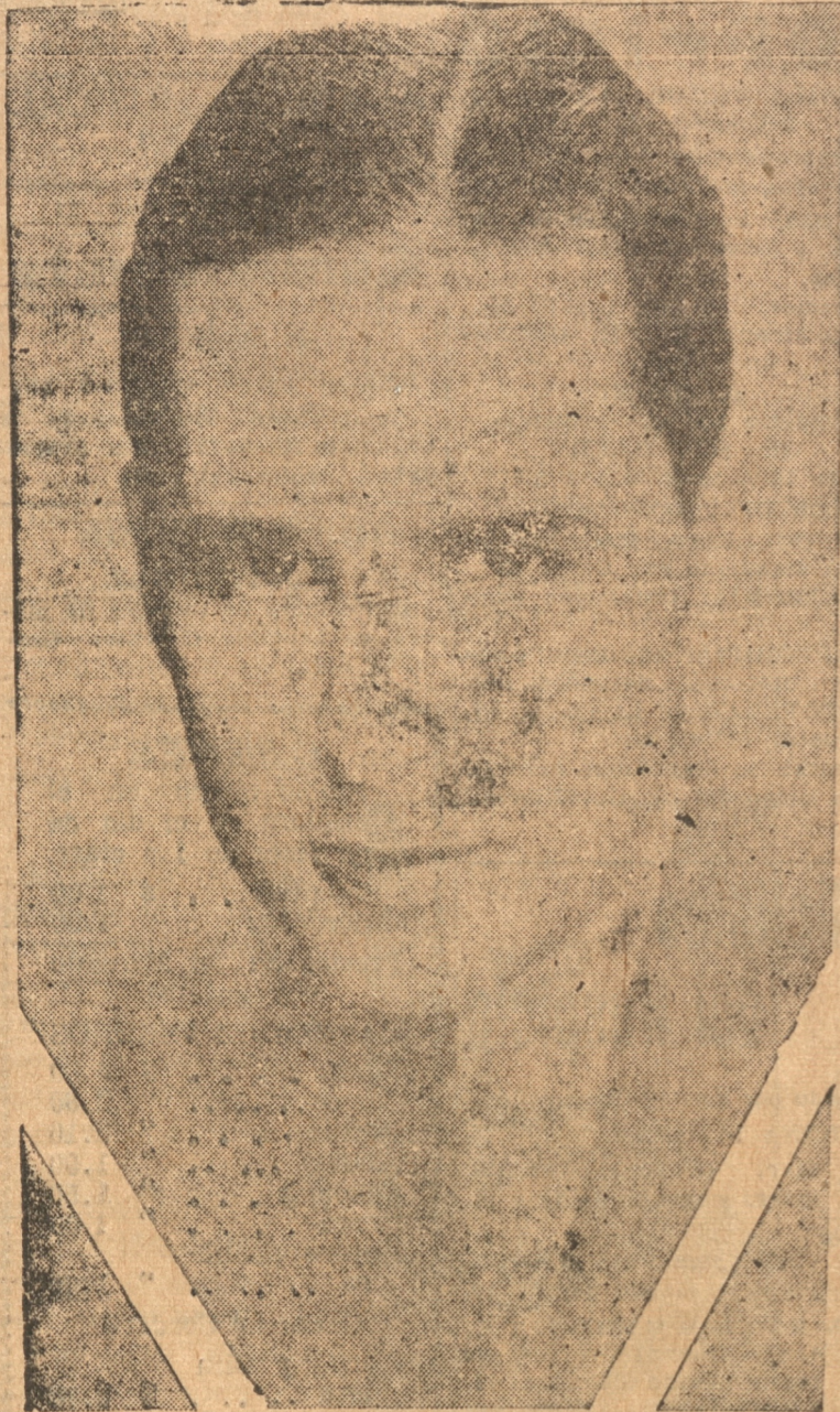
BEN LYON, de R. K. O. y Warner Bros, cuyos últimos triunfos le colocan en destacado lugar en la pantalla.