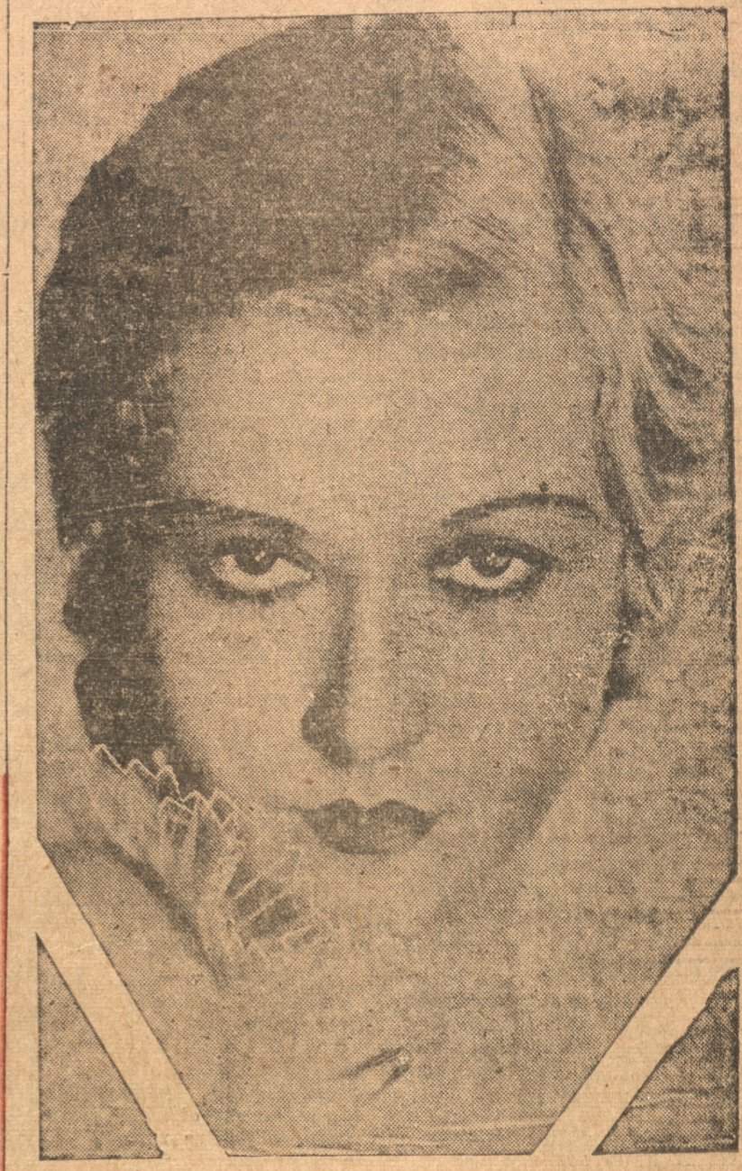
EVALIN KNAPP, una de las nuevas figuras del cine que actúa en Warner Bros.