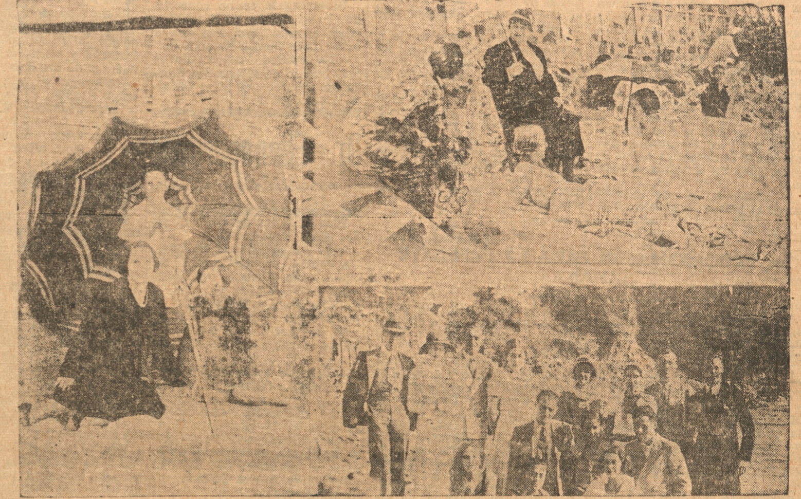
El verano en las playas del Morro de Tomé.