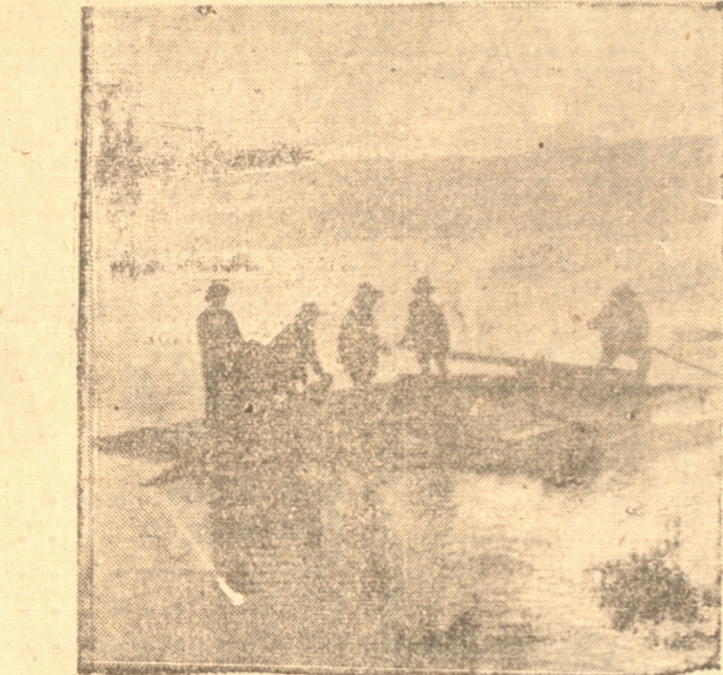
Otra balsa en el medio del río Bio-Bio

Hemos tenido oportunidad de conversar con algunas personas que han tenido intervención en estos viajes, y se han manifestado muy optimistas con respecto a los resultados de ellos. Las maderas traídas por el río presentan la ventaja de adquirir mejor calidad, por cuanto una vez que se secan tienen esa calidad porque están libres de savia y otras materias. El viaje demora alrededor de ocho días y en cada balsa se ocupan dos hombres, teniendo trabajo en estas faenas alrededor de 150 obreros. Como es fácil comprender, los dineros destinados a gastos de fletes se destinan a pagar numerosos obreros con lo cual se contribuye a disminuir la escasez. Curioso es hacer notar que para traer los convoyes de balsas, se necesita de los servicios de una persona experta en el río, a quien se llama "biobiano", sirviendo actualmente para este cargo un antiguo conductor de convoyes que ya años atrás desempeñó este mismo cargo y que ahora goza de excelentes emolumentos.