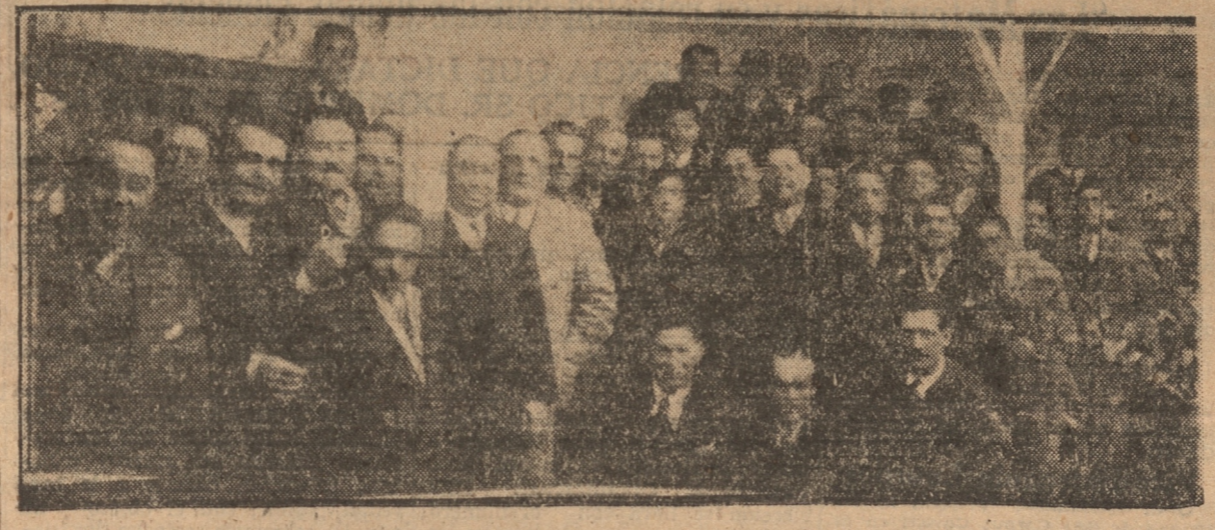
GRUPO DE LOS ASISTENTES AL VERMOUTH DE HONOR

Le siguieron en el uso de la palabra el Intendente señor