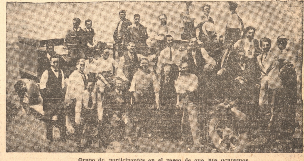
Grupo de participantes en el paseo de que nos ocupamos.

Se efectuó últimamente. — Agradecimientos que nos piden dar a la publicidad