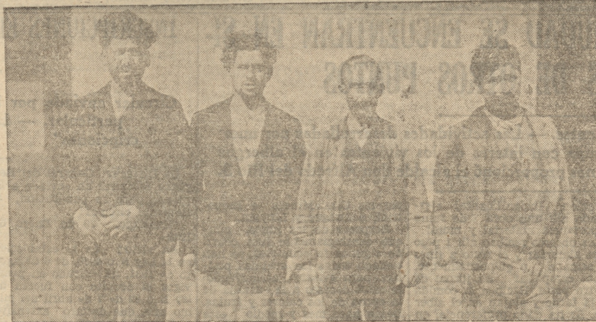
LOS CUATRO DETENIDOS DESPUES DE HABER SIDO PUESTOS A DISPOSICION DEL JUZGADO RESPECTIVO

Algunos de esos animales fueron muertos detrás de la Tracción Eléctrica, desde donde