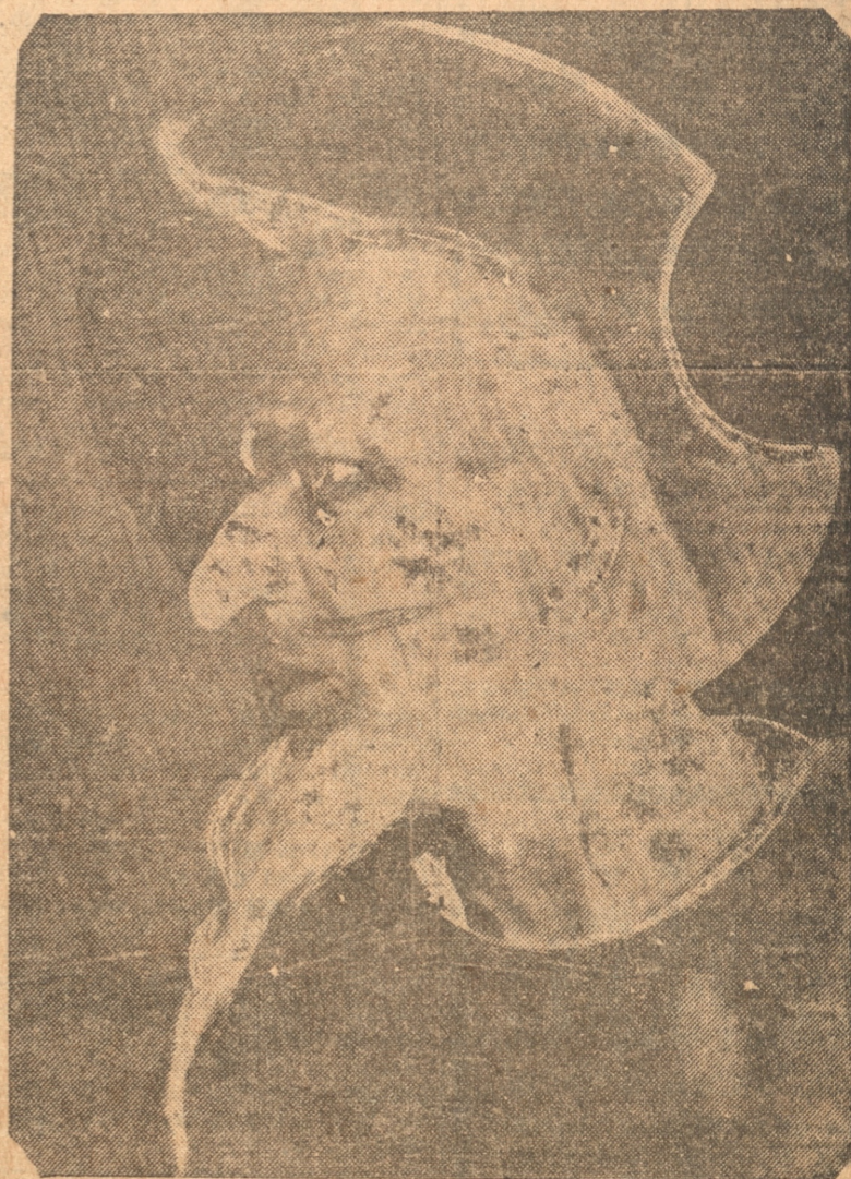
El protagonista de la ópera "Don Quijote", de Massenet, encarnado por el famoso artista ruso Fedor Chaliapin, tan eminentemente actor como sobresaliente cantante.