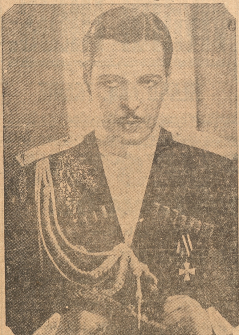
Ivan Lebedeff, el actor ruso, que empieza a imponer su temperamento en Hollywood.