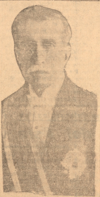
DON AUGUSTO LEGUIA S.

Dejó de existir a las 2.38 horas, después de haber sido sometido a una segunda operación. — Se encontraba en el Hospital Naval de Bella Vista. — Algunos rasgos de la vida del exmandatario peruano