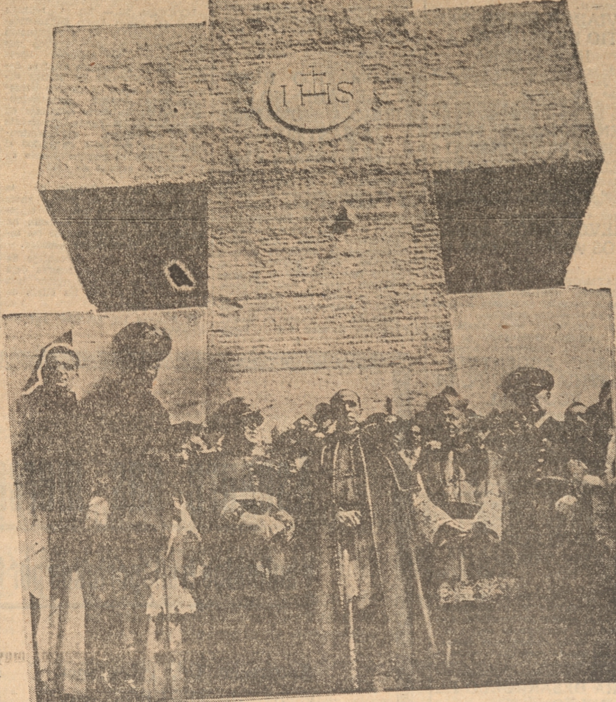
LA GIGANTESCA CRUZ DE PALERMO

repartirlas después en comunión a los defensores de la patria. Los sacerdotes pasan por las filas de militares; los jefes y oficiales reciben la comunión al plé de la Cruz. Los seminaristas de todos los Seminarios de la República, y