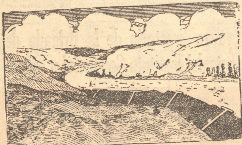
El croquis representa una vista, a vuelo de pájaro, de la posible disposición de los tajamares con los cuales se estrecharía el cauce del Bio - Bio para provocar un deslizamiento más rápido de las arenas hacia el mar.

LA OBRA NO SERIA COSTOSA EN RELACION CON LAS UTILIDADES QUE PRESTARIA. — LO QUE MANIFIESTA "LAS ULTIMAS NOTICIAS" SOBRE EL PARTICULAR. — UN PROYECTO DE FACIL ESTUDIO Y DE POSITIVOS RESULTADOS. — EL PROBLEMA AFECTA HONDAMENTE A LA RIQUEZA Y PORVENIR DE TODA LA REGION