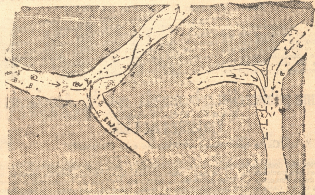
LAS FLECHAS NEGRAS SIGNADAS CON EL N.º 1 INDICAN EL CURSO DE LAS AGUAS EN EL CASO DE LLEVAR EL BIO - BIO UNA CORRIENTE O CAUDAL MUY SUPERIOR AL LAJA, LO CUAL OCASIONA LA FORMACION DE LOS BANCOS DE ARENA SEÑALADOS CON EL N.º 2, 3, 4, 5, 6, 7, 8, 9, 10, 11, 12, 13, 14, 15, 16, 17, 18, 19, 20, 21, 22, 23, 24, 25, 26, 27, 28, 29, 30, 31, 32, 33, 34, 35, 36, 37, 38, 39, 40, 41, 42, 43, 44, 45, 46, 47, 48, 49, 50. CUANDO SE PRODUCE EL CASO A LA INVERSA, LA CORRIENTE TOMA EL CURSO APROXIMADO INDICADO CON LAS FLECHAS DE PUNTO Y SIGNADAS CON EL N.º 2, OCASIONANDO, POR CONSECUENTE LA FORMACION DE BANCOS EN LOS PUNTOS 2, 2 a, 2 b, etc. ESTO ESPLICA LA CONSTANTE MOVILIDAD DE LOS BANCOS DE ARENA

Se comprende que las ideas que ponemos y los gráficos con que hemos tratado de explicarlas objetivamente, tienen el carácter de base para estudios completos y definitivos que pueden realizarse fácilmente aprovechando los elementos técnicos de las reparticiones fiscales encargadas de considerar esta clase de proyectos. En el orden práctico, para determinar técnicamente la posibilidad de realizar estos proyectos podría levantarse un plano fotográfico del curso del Bio-Bio, lo que es hoy día un trabajo sencillísimo, pues la Línea Nacional de Aeronavegación lo ejecuta en forma muy completa. El levantamiento de un plano como el que indicamos, permitiría conocer los obstáculos que existen para la navegabilidad del Bio-Bio las posibilidades que favorecie-