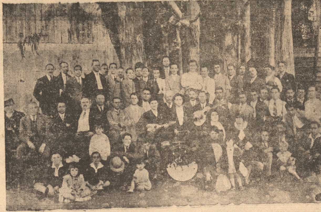
GRUPO GENERAL DE ASISTENTES AL PASEO DEL A. ITALIANO

Sus socios efectuaron un paseo a la Quinta Macera