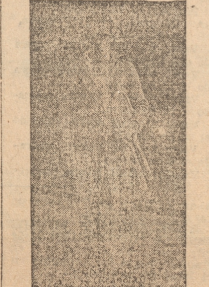
COCHET, el "as" mundial de tennis

Cochet se confesó profesional ante los periodistas, convocados al efecto en un elegante y célebre "bar" de la rue Royale — "Chez Maxims".