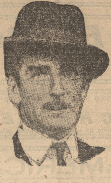
CAPITAN ANTHONY EDEN, que representará a Gran Bretaña en la sesión de hoy