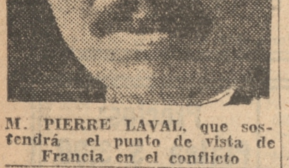
M. PIERRE LAVAL, que sostendrá el punto de vista de Francia en el conflicto

Las conversaciones las continuarán en Ginebra, y formará parte de un esfuerzo que es como la base de acción para asegurar la paz entre Italia y Etiopía, como un medio de transacción. PARIS, 30.—(UP).— En la sesión del Gabinete M. Laval hizo un bosquejo de la situación internacional, que duró una hora.