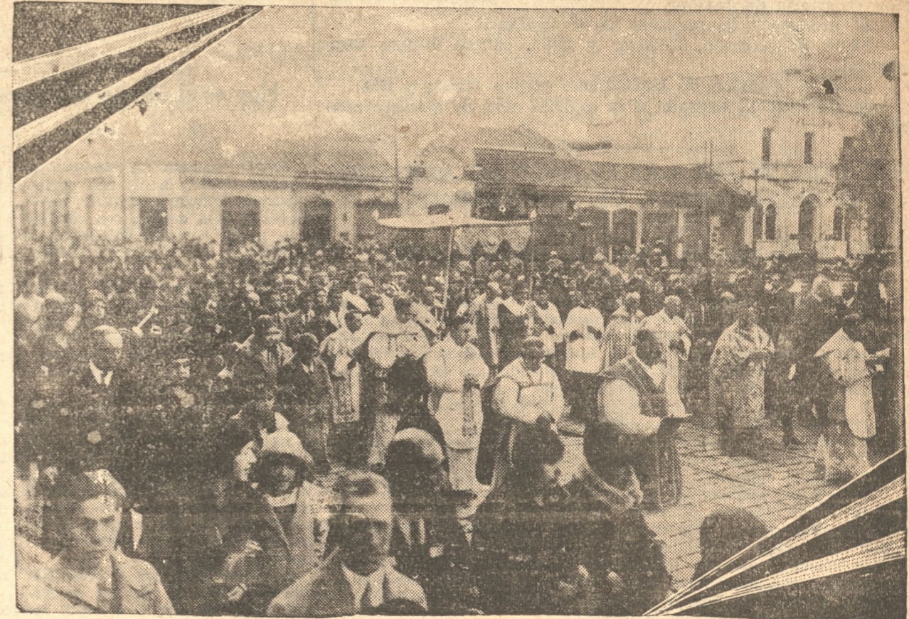
UNA MULTITUD DE FIEL ES PARTICIPA EN LA PROCESSION DE CORPUS CHRISTI

Pierna y chuletas, el kilo $ 3.— Espaldilla, costilla y espinazo, el kilo $ 2.80