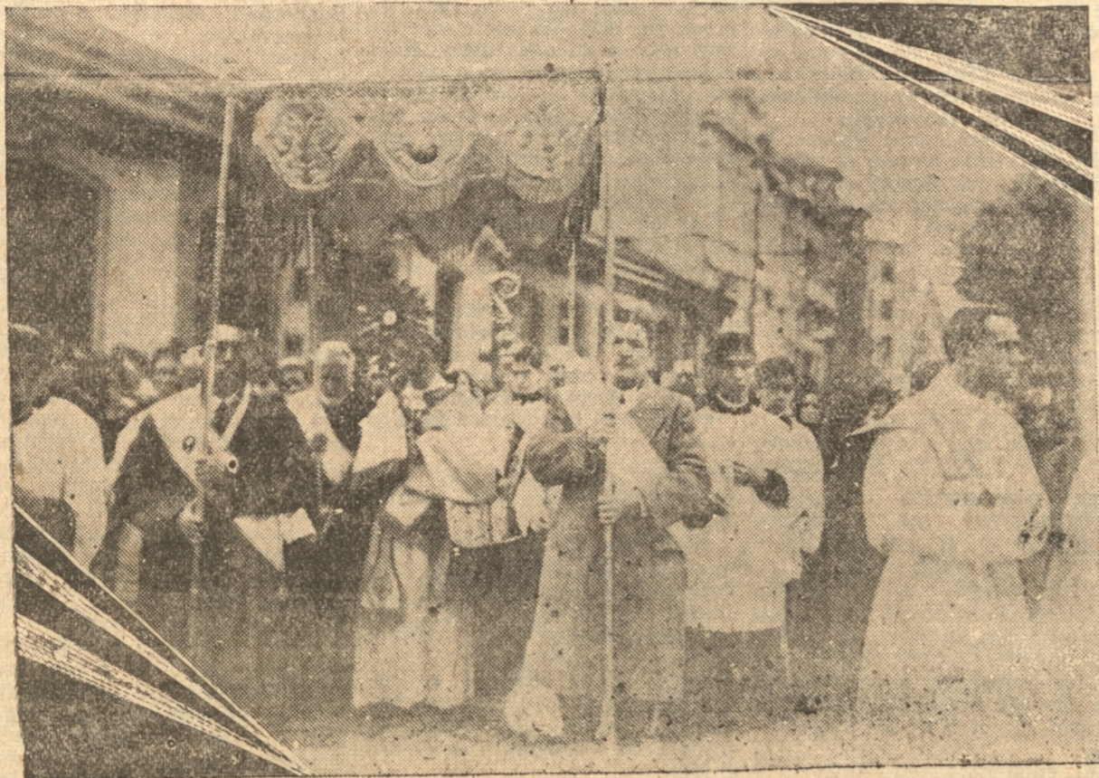
LA PROCESSION REGRESA A LA CATEDRAL

Como anunciamos, ayer se efectuó la tradicional procesión de Corpus Christi, que por orden expresa del Iltmo. obispo de Concepción, cuyo decreto publicamos, debía revestir este año, especial solemnidad.