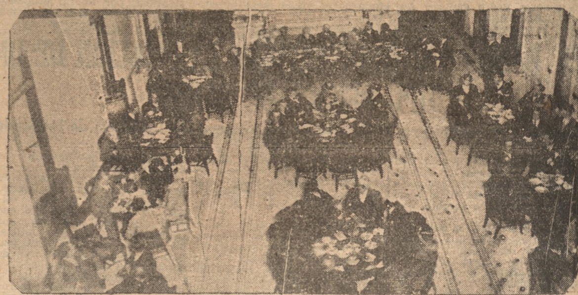
VISTA PARCIAL DEL HALL DEL CLUB CONCEPCION DURANTE EL APERITIVO DE ANOCHE