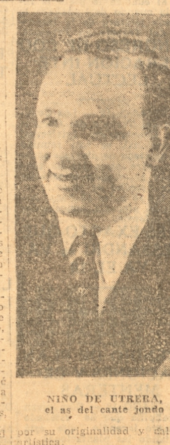
NIÑO DE UTRERA, el rey del cante jondo

por su originalidad y calidad artística. Continuaremos dando amplios detalles del debut.