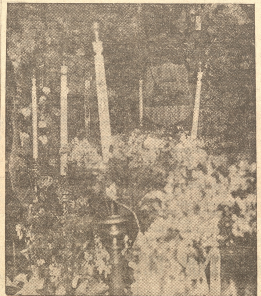
LA CAPILLA ARDIENTE QUE SE ERIGIRA AL SEÑOR PORTER

tituciones representadas, con su correspondiente escolta, debiendo ir de a dos en fondo.