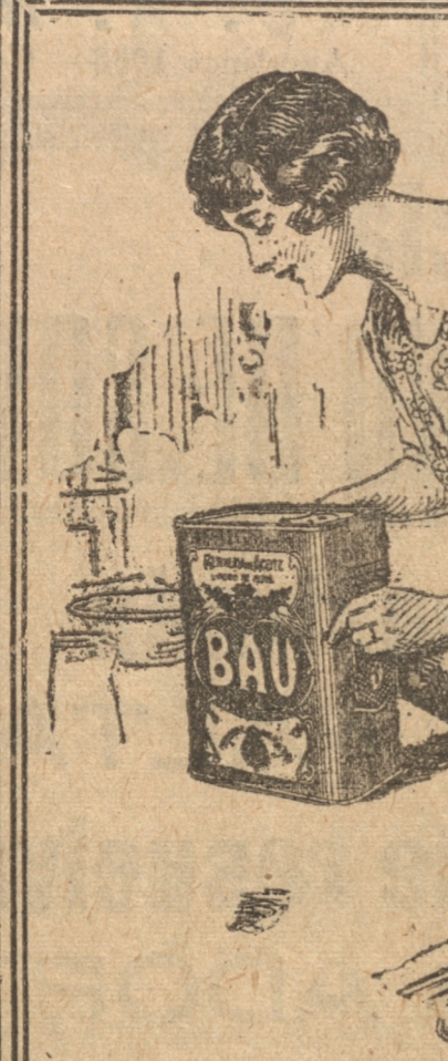
En sus comidas no debe faltar el exquisito

En este, en breves líneas, y a grandes rasgos la labor que le ha correspondido desarrollar a la Sanidad Municipal, con sus dos secciones técnicas: la Junta de Higiene y Bromatología, entidad técnica asesora de esta H. Junta de Vecinos, y la del Laboratorio Municipal con su escaso personal técnico con su cuenta, que a pesar de este factor en contra, ha podido llevar a cabo en una forma continua el control de los diferentes artículos alimenticios, pudiendo dar a la ciudad la seguridad que la mayoría de los alimentos que consume son apropiados para la alimentación y que aquellos que aún no cumplen con las diferentes ordenanzas y reglamentos que hay para ellos serán sancionados como lo confirman las 375 citaciones efectuadas al Juzgado