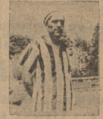
GUITARD, del Victoria de Chile

año pasado actuaban en series inferiores. Buen ejemplo de los juveniles. A pesar de los levantamientos que le han hecho se mueven optimistas y sus dirigentes piensan hacer mas de "algo" con su equipo. El Fernández Vial pre-