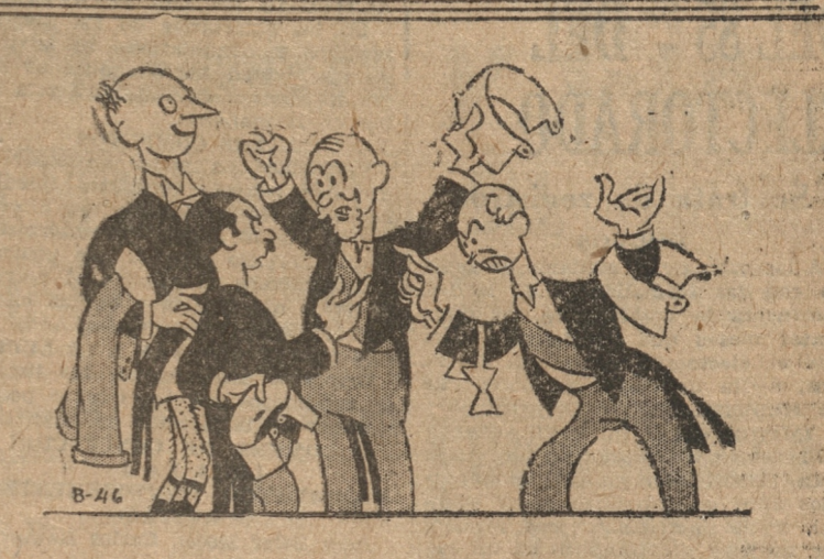
(De "El Romancero de Pipo")

El ministro de Justicia acusó recibo del oficio de la Corte de Apelaciones de Concepción en que le comunicaba que tan pronto se termine la nueva sección del edificio que ocupa el tribunal, la Corte procederá a dividirse en tres salas. Respecto del mobiliario que le ha solicitado para dotar la nueva sala, el ministro le pide que indique que muebles y útiles necesarios son de mayor urgencia, con el objeto de arbitrar los fondos necesarios.