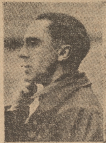
HERR GOEBBELS, que pronunció un discurso ayer en Danzig

que queda muy poco que hacer en este sentido; pero el valor simbólico de las elecciones, que darán a los nazis un 75 por ciento de los mandatos, constituirá, según ellos, un excelente medio de propaganda y, al mismo tiempo, una advertencia para Austria. "Asimilación sin reanexión", tal es la fórmula que parece concretarse ahora. DANZIG, 6. — (UP). — Se calcula que ahora los votantes nazis serán mañana de un setenta a un ochenta y cinco por ciento. Numerosos oradores del Reich y nazis han continuado poniendo en relieve las ideas germanistas en vez de los intereses locales. DANZIG, 6. — (UP). — Hoy, después de tres semanas, se ha puesto término al torbellino que ha significado la campaña electoral del Partido Nacional Socialista, con el discurso pronunciado en una amplia asamblea verificada al aire libre en una plaza céntrica de la ciudad por el Ministro de Propaganda del Reich y uno de los