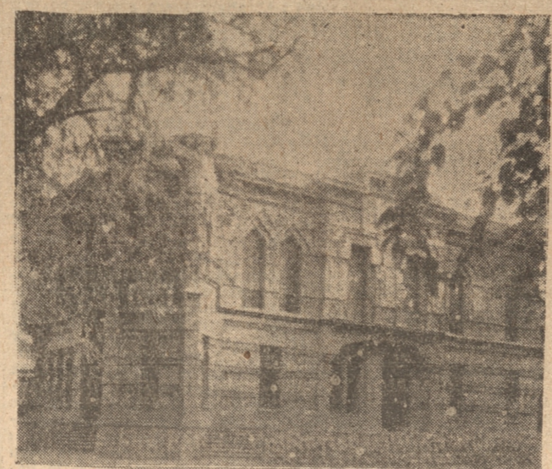
EDIFICIO EN QUE FUNCIONA LA CLINICA DEL CARMEN

Este sanatorio santiaguino aplica estos métodos, por primera vez en la república