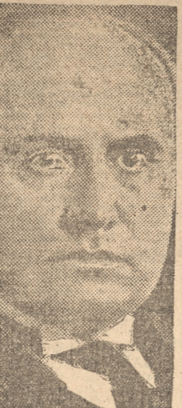
Mussolini que intervendrá en la cuestión de Austria

BERLIN, 25. — (UP). — Informaciones provenientes del Tirol hacen saber que se ha declarado allí el Estado de Emergencia y que la policía y el ejército ocupan los edificios públicos.