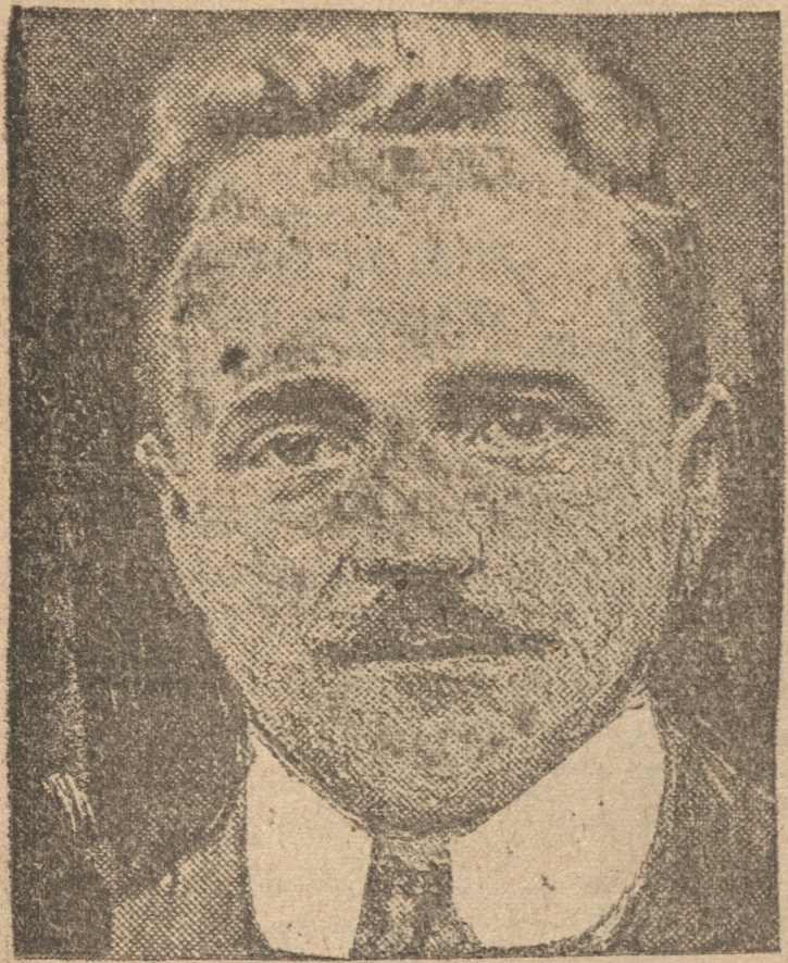
Canciller Dollfuss que fué muerto a balazos durante el ataque de los nazis a la Cancillería.

EL PREMIER MUSSOLINI NO PERMITIRIA QUE AUSTRIA SE HICIERA NACISTA, SIN UNA SERIA INTERVENCION ITALIANA