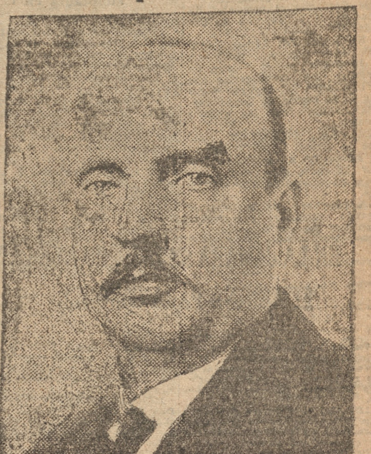
Presidente Miklas que encargó la formación del nuevo Gobierno al Ministro de Instrucción Schuschnig.

PRAGA, 25. — (UP). — Informaciones privadas que han llegado vía Pressburg, dicen que el Canciller Dollfuss sufrió a causa de graves heridas en el pecho que recibió en el tiroteo que se produjo cuando los rebeldes entraron a la Cancillería.