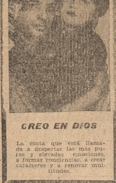
CREO EN DIOS