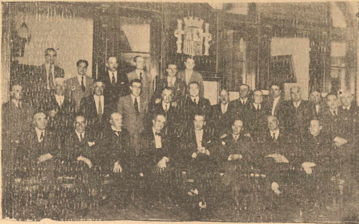
Asistentes al Jerez de honor efectuado en el Centro Español.

"España, Madre Nuestra", ha sido su charla de hoy, y estoy seguro que con la extraordinaria lucidez de su palabra, nos deleitará en la forma que acostumbra.