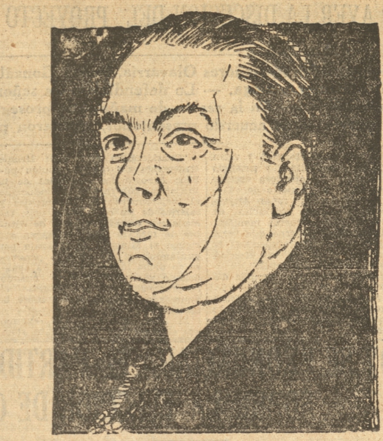
Excmo. señor don Diego Martínez Barrio, Presidente provisional de la República Española, cuyo quinto aniversario se celebra hoy