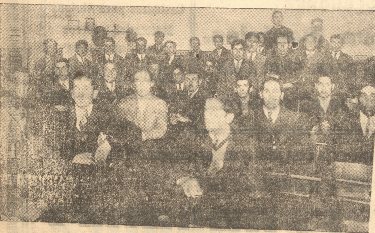
Uno de los cursos inaugurados ayer

Como ha podido verse, el señor Intendente de la Provincia, ha visto con gran complacencia estos cursos y ha aplaudido con entusiasmo la obra de los estudiantes universitarios penquistas.