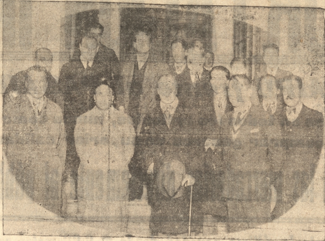
Grupo de autoridades en la inauguración de los cursos técnicos de la Universidad Popular

El entusiasmo con que los centros universitarios han abordado este año sus programas de trabajo, la abnegación que se advierte en la muchachada estudiantil, hace presagiar que esta obra será de positivo provecho para la clase trabajadora que ha respondido en forma admirable a la iniciativa de los estudiantes.