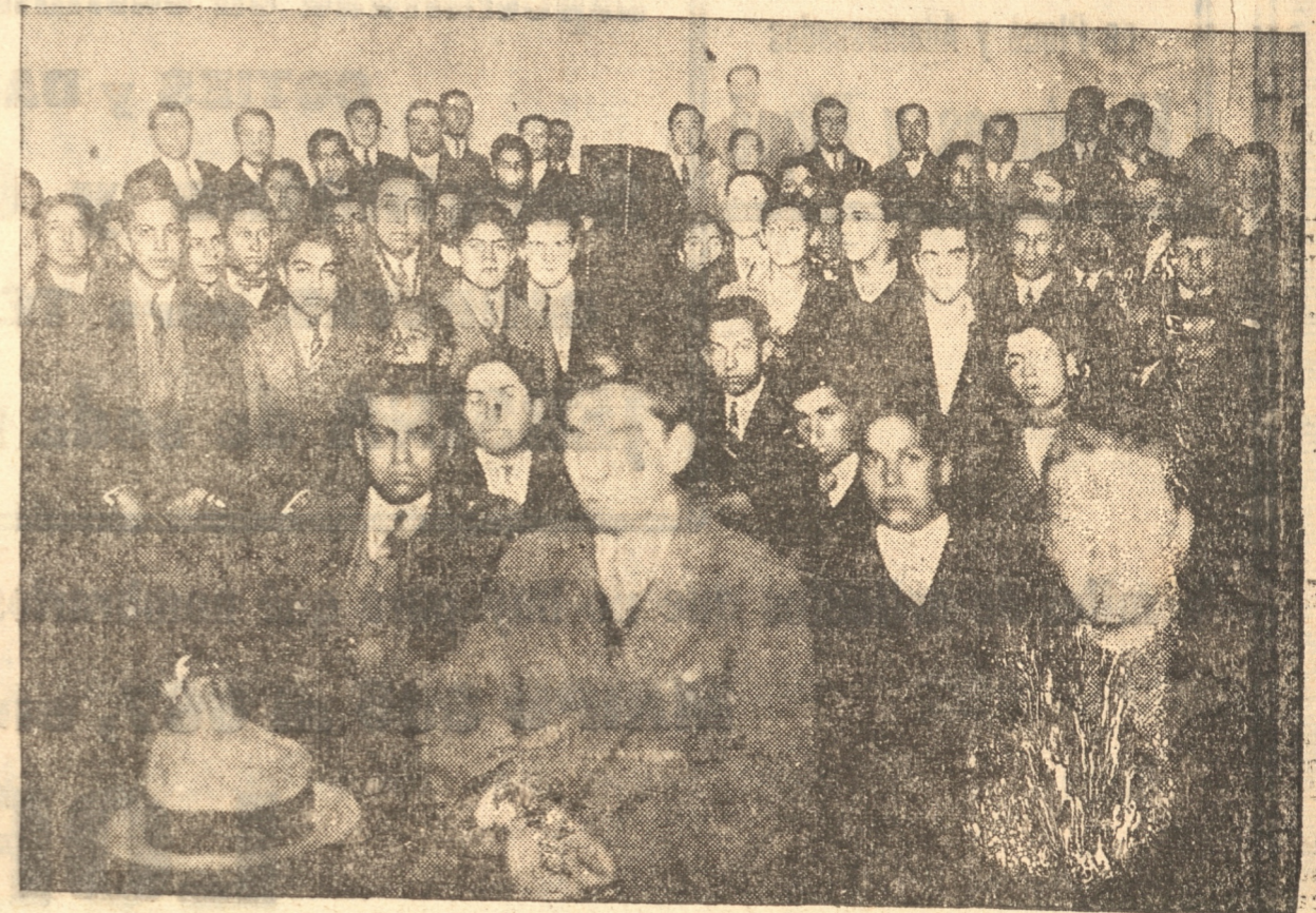
Otros de los cursos de este ciclo

Las clases, a cargo de dos distinguidos estudiantes de Medicina, abarcarán todos los problemas que tienen relación con el niño, así como por ejemplo, su alimentación, suario e higiene, como también