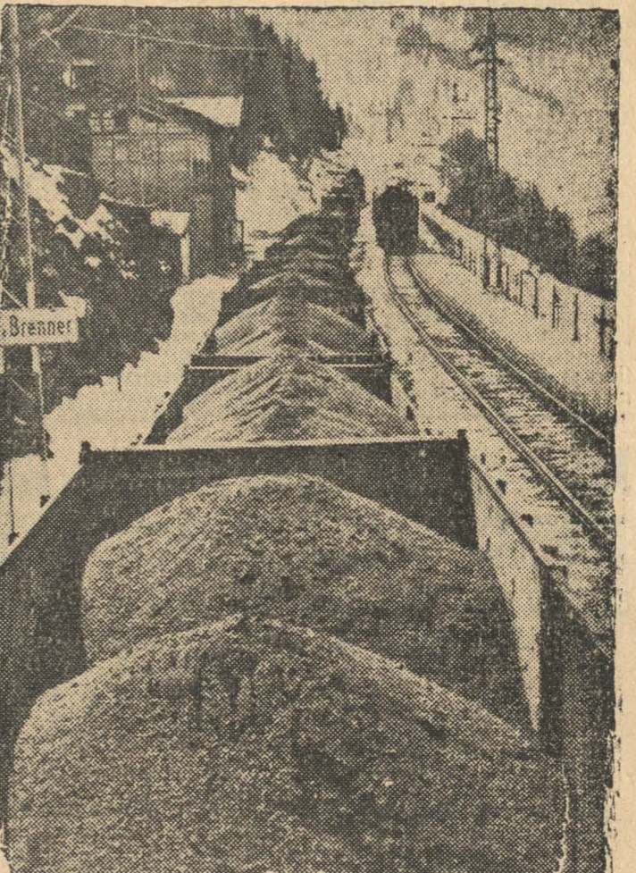
Casi toda la importación de carbón llega ahora a Alemania por vía terrestre. La viciela muestra el transporte de ese artículo sobre el Brenner

ROMA, 16. — (UP.) — Un vocero oficial dijo que las informaciones emanadas de Londres que afirmaban que Italia invadiría a Yugoslavia eran infundadas y tendenciosas.