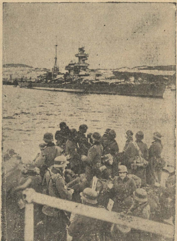
Desembarcan tropas en Noruega.— Con la ofensiva aliada contra Narvik, vuelve a cobrar de nuevo intensidad la campaña en ese país

MOSCU, 16, (U. P.) — Los diarios rusos acusan a Gran Bretaña y Francia de provocar esta guerra imperialista. Dan a entender que el conflicto puede propagarse a los Balcanes, Mediterráneo y Cercano Oriente.