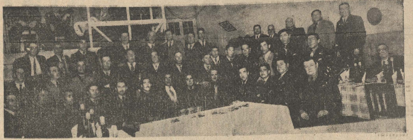
Grupo de asistentes a la manifestación que el Sindicato de comerciantes en Casimires y Similares, ofreció ayer con motivo de la elección de su nuevo Directorio. — A esta reunión asistieron también los miembros del directorio que termina y algunas personas es pecialmente invitadas