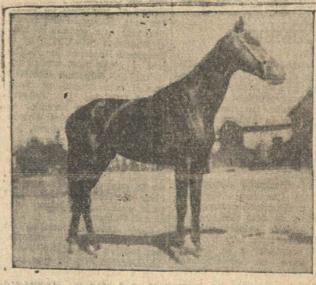
COINTREAU. El buen hijo de Brown ha tenido una lucida actuación que culminó con su triunfo del domingo.