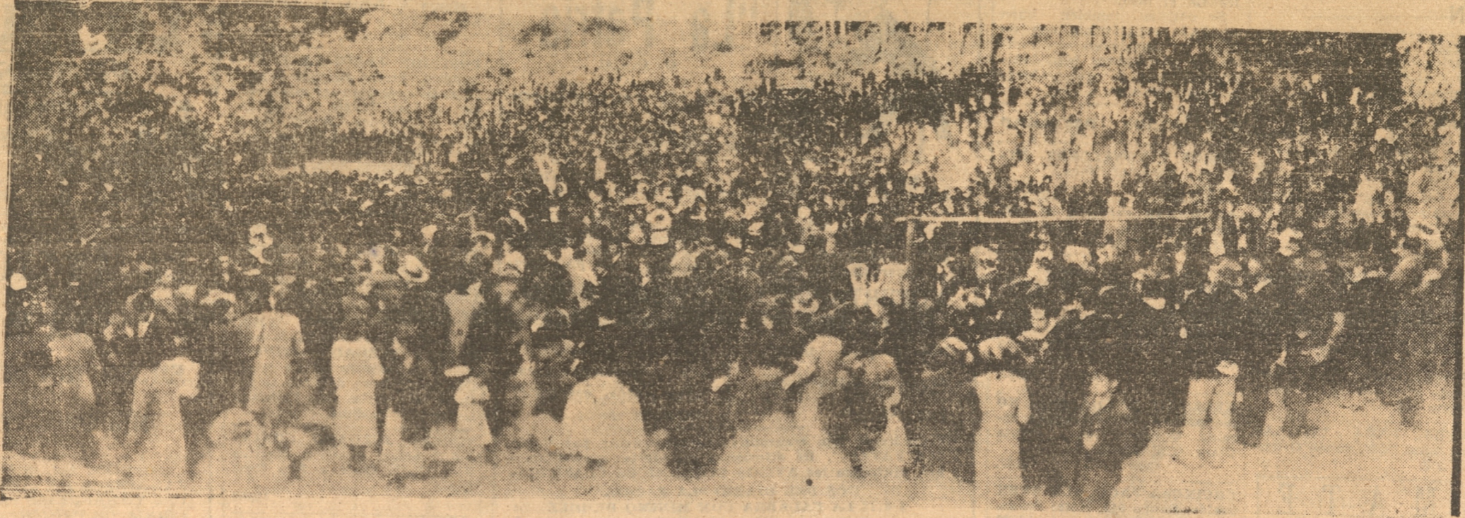
ASPECTO GENERAL DE LA ENORME CONCURRENCIA QUE ASISTIO AYER A LA ROMERIA DE PURISIMA

El templo presentaba a las 10 horas un espléndido golpe de vista. El altar Mayor hacia sus mejores gala de guirnaldas, crespones, banderas de la Inmaculada, lemas especiales y una profusión de bellísimas flores de la estación, que admiraba a la grandiosa concurrencia de fieles que invadía el extenso templo Diocesano. En el Coro estaba todo el Venerable Cabildo Eclesiástico, el Seminario con su profesorado, Clero regular y secular. La misa de la festividad en el altar la oficiaba Monseñor Rafael Piedra, asistido por varios sacerdotes, maestros de ceremonias y cíe-