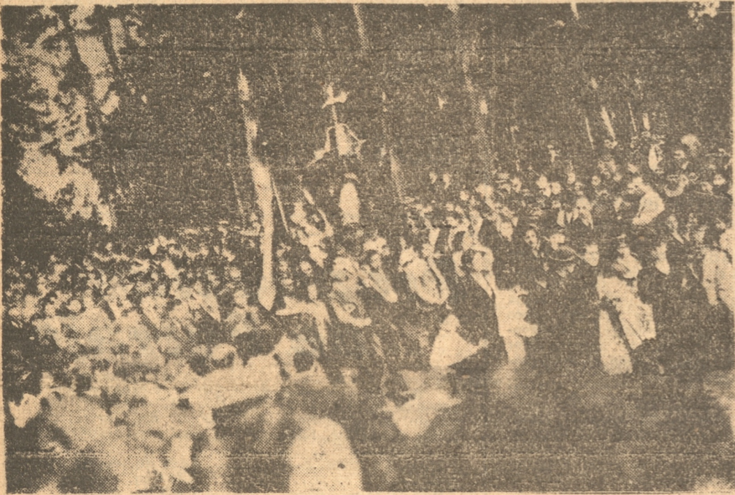
DURANTE LA SUBIDA AL CERRO POR LAS INSTITUCIONES CATOLICAS