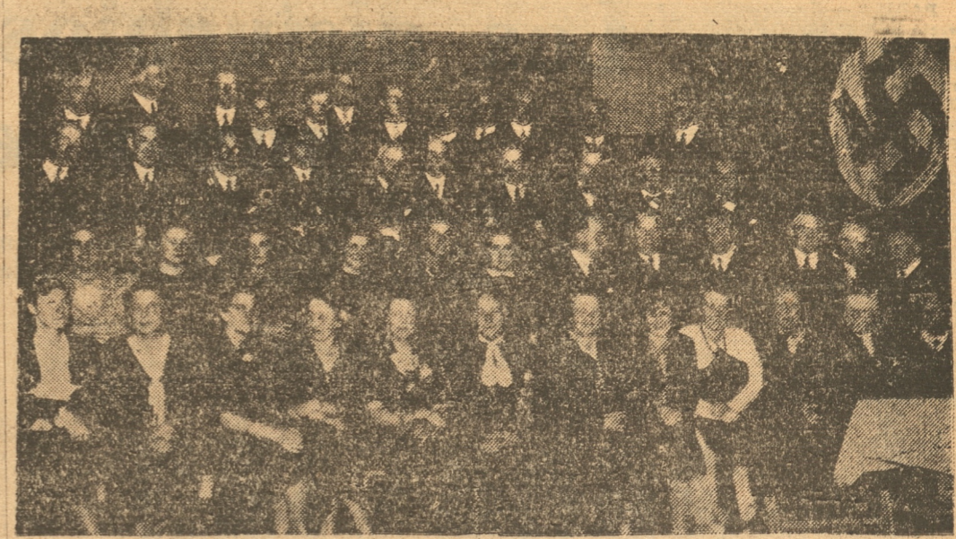
Asistentes a la comida que los miembros de la Colonia Alemana residente ofrecieron anoche al señor Consejero de la Embajada Alemana de Santiago y señora, e nel local del Club Alemán.

UN PENSAMIENTO.— La exaltación por encima de la virtud es una de las maldiciones del siglo.— Channing