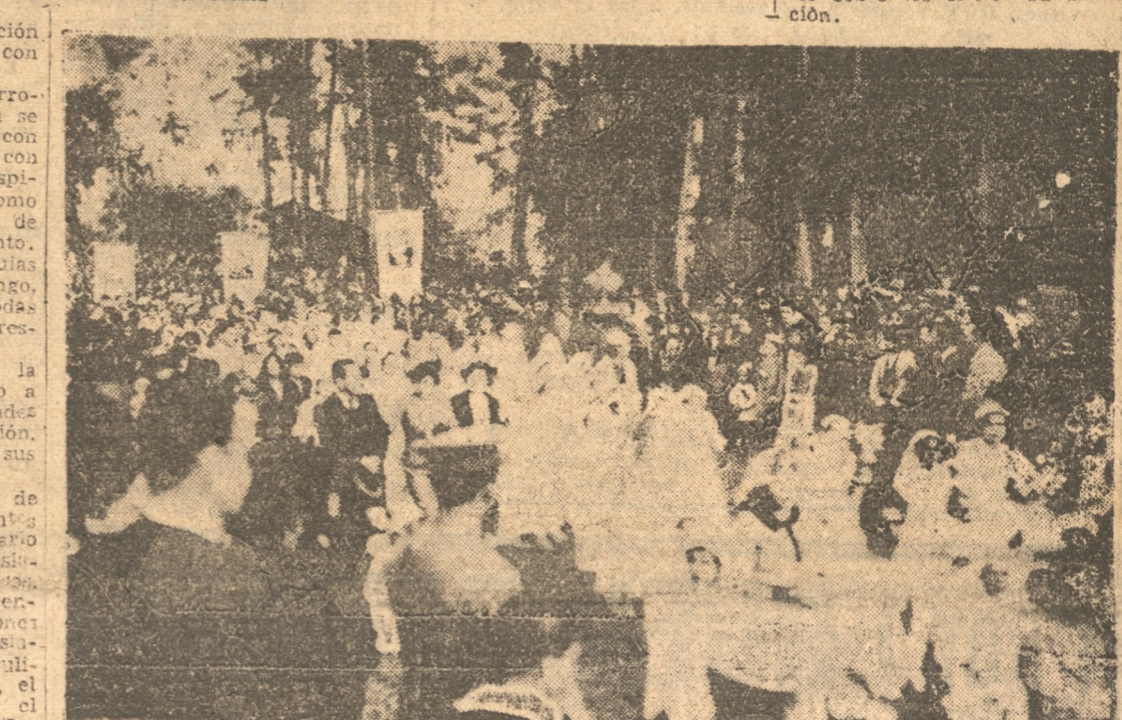
OTRO ASPECTO DE LA PROCESION DE AYER

ImpONENTE espectáculo ofrecía el paso de la columna de fieles por Barros Arana, que abarca cuartas y cuartas en filas inintermitentes. Los colores de las banderas y de los estandartes daba una nota especial al desfile, que se efectuó durante todo su desarrollo siguiendo el mayor orden y respeto. En las aceras de nuestra principal vía, desde la Plaza Independencia hasta el Seminario, se habían estacionado miles de personas, como también numerosas familias, desde