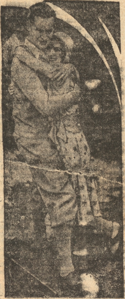
ROBERT MONTGOMERY and DOROTHY JORDAN in "LOVE IN THE ROUGH"

NO Ud. de AMOR sin ver esta deliciosa comedia musical que hará sentirse dichosos los jóvenes, y a los viejos sentirse jóvenes.