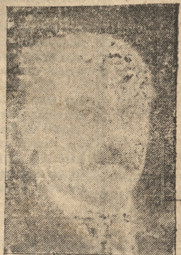
M. ALBERT LEBRUN, uno de los más probables sucesores de M. Doumer