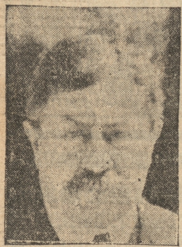
M. PAUL PAINLEVE, a quien se cree un posible sucesor de M. Doumer

EL PUEBLO DE PARIS CONducIRA LA CARROZA. — MANIFESTACIONES DE DUELO EN FRANCIA Y EL EXTERIOR. — EL MARTES ELEGIRA LA ASAMBLEA NACIONAL EL SUCESOR DE M. DOUMER. — LA PRENSA DEL SOVIET DICE QUE GORGOULOFF ES UN ENEMIGO DEL REGIMEN