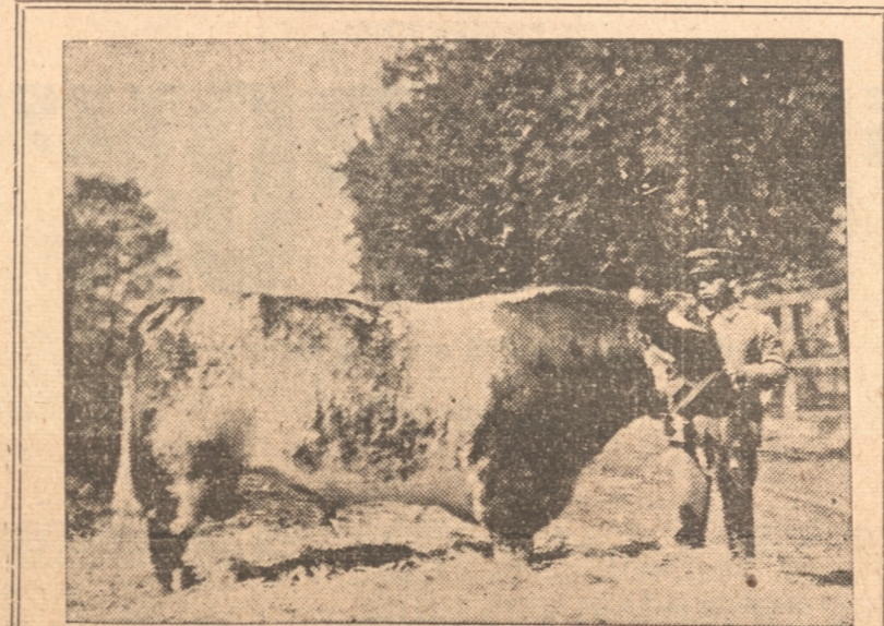
Faithful Pride of Rothet Primer Premio de Categoría. — Premio Campeón al mejor torc nacido en el país. — Premio de Grupo a los tres mejores toros. — Premio Biológico al Grupo de los tres mejores toros, tipo carne.