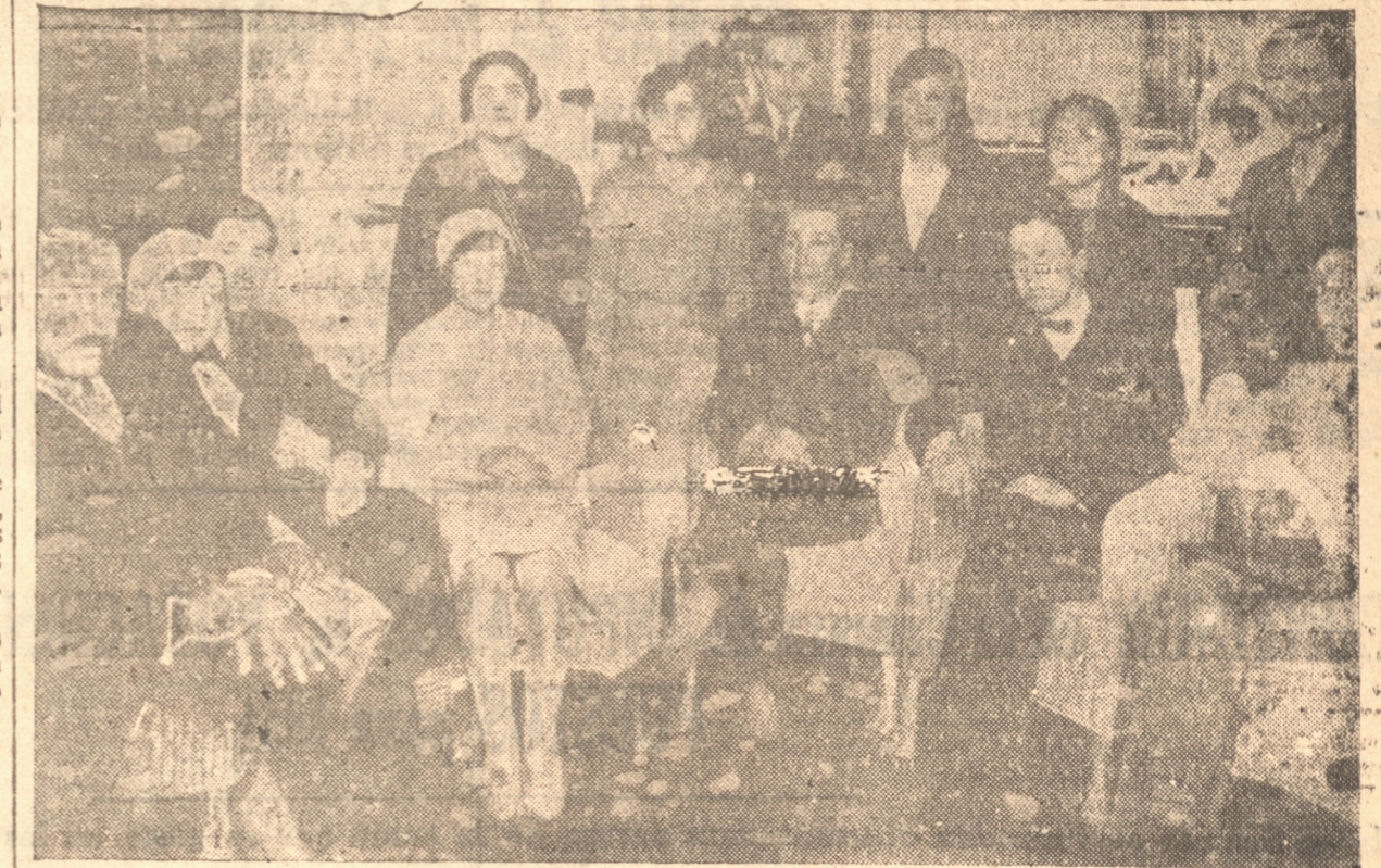
EL PERSONAL DEL ESTABLECIMIENTO Y ALGUNOS DE LOS INVITADOS A LA INAUGURACION

Los artículos puede adquirirlos el público casi directamente del productor.