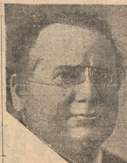
LITVINOFF, Comisario de Relaciones de la U. R. S. S.

ADEMAS HABRIAN CONVERSADO SOBRE EL PACTO DE EUROPA ORIENTAL. — DURANTE UNA HORA CONFERENCIARON EL CANCELLER FRANCES Y EL JEFE DE LOS SOVIETS, CONSTITUYENDO SU REUNION EL ACONTECIMIENTO MAS IMPORTANTE DE LA DIPLOMACIA EUROPEA ACTUAL