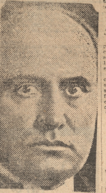
MUSSOLINI, que ayer, por primera vez, habló públicamente de la disputa de su país con Abisinia.

El Embajador chileno se embarcará mañana en Southampton a bordo del "Majestic", rumbo a New York.