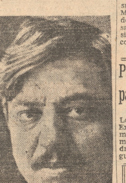
El Canciller francés M. LAVAL

Dicen los observadores que esta reunión les recuerda la que celebraron el Zar Nicolás y el Presidente Poincaré en 1914, cuando Francia y Rusia trataron de oponerse a los esfuerzos expansionistas de Alemania; sin embargo, la prensa rusa ha de notar que el acercamiento actual difiere de aquel otro en cuanto ahora no interesan las maniobras imperialistas entre las potencias sino que solamente preocupa el hecho de conservar la paz en Europa.