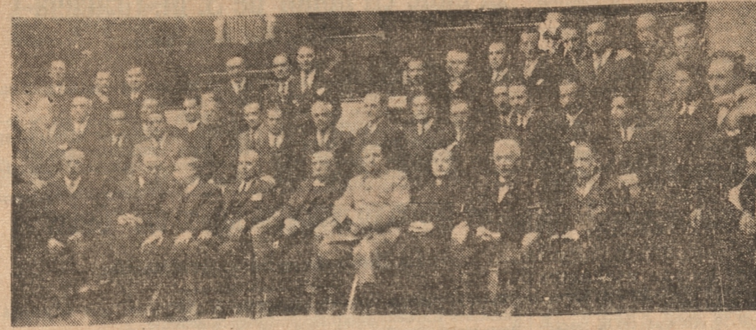
ASISTENTES AL VERMOUTH DE AYER EN EL CENTRO ESPAÑOL

La orquesta ejecutó la Can- ción Nacional y el Himno a