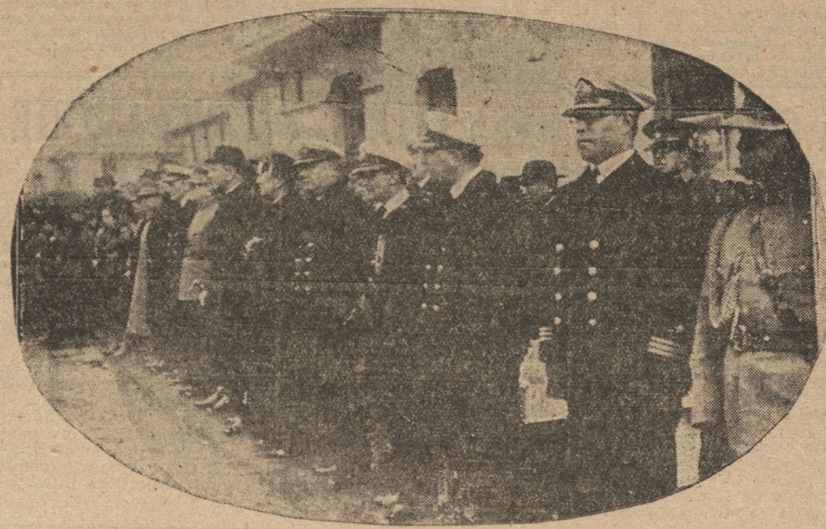
LAS AUTORIDADES PRESENCIANDO EL JURAMENTO DE LA BANDERA

LOS TRES REGIMIENTOS DE LA GUARNICION SE CONGREGARON EN EL REGIMIENTO CHACABUCO. — LAS DIVERSAS AUTORIDADES ESTUVIERON PRESENTES EN EL ACTO. — BRILLANTISIMA FUE LA PRESENTACION DE LAS TROPAS