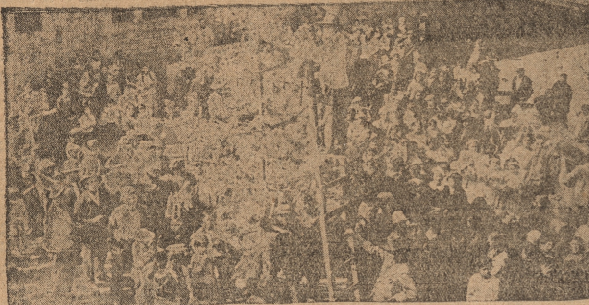
DURANTE LAS FIESTAS DE AYER EN EL ALBERGUE

A mediodía de ayer se efectuó en el Albergue el almuerzo que la Municipalidad ofreció a los cesantes, como celebración de la Fiesta de Navidad.