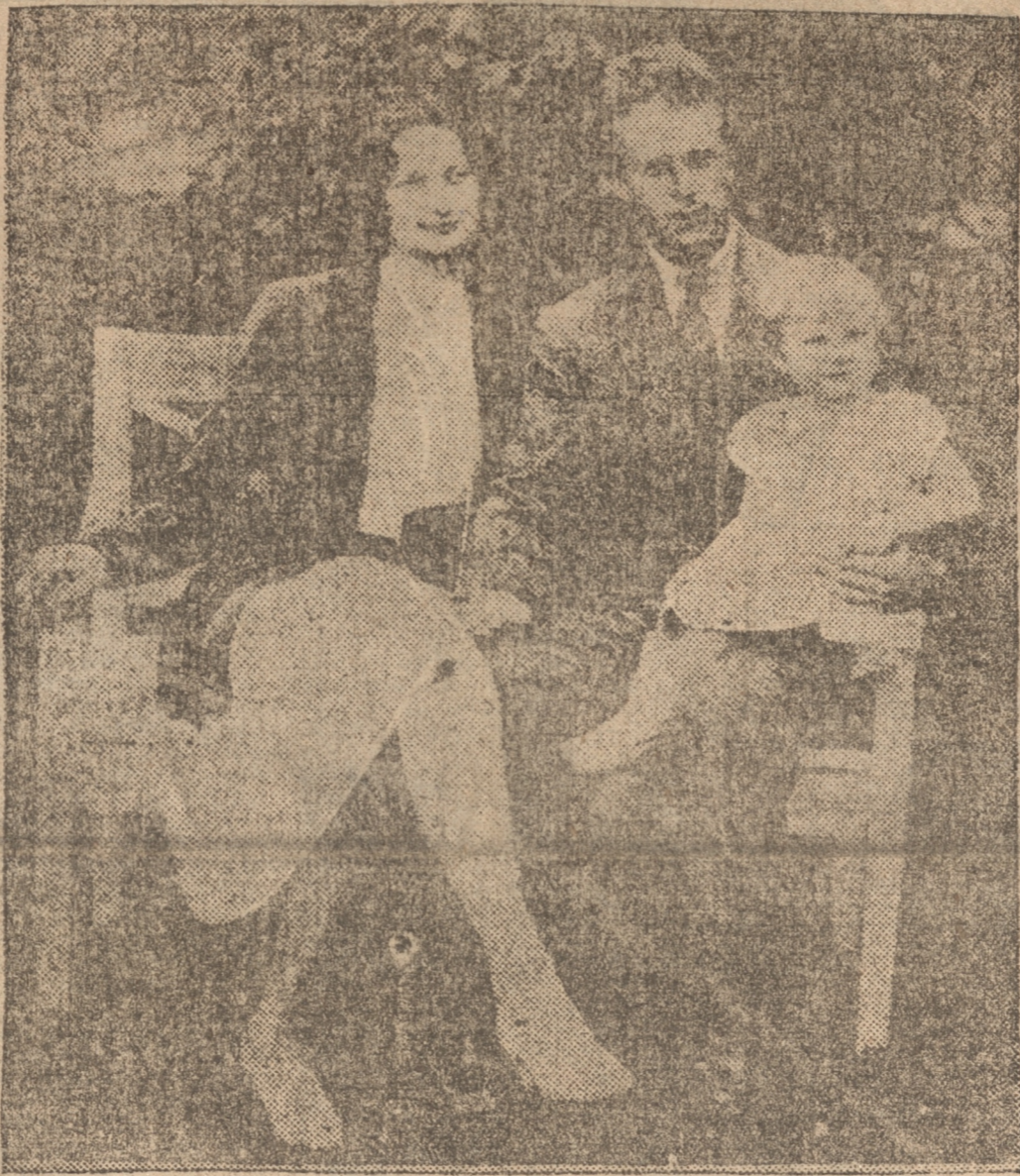
EL PRINCIPE LEOPOLDO, SU ESPOSA LA PRINCESA ASRID Y SU HIJITA

Aun desde los más apartados rincones del mundo llegan sentidas condolencias.— El Príncipe Leopoldo y su esposa estuvieron una hora en la cámara mortuoria.— El homenaje de diversas naciones.— La soberbia capilla ardiente erigida en el Palacio Real de Bruselas