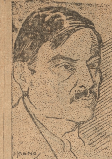
LA CAIDA DEL GABINETE FRANCÉS

Si recibe el voto de confianza se dirigirá a Ginebra, el miércoles, para continuar a la cabeza de la delegación francesa a la Conferencia del Desarme.