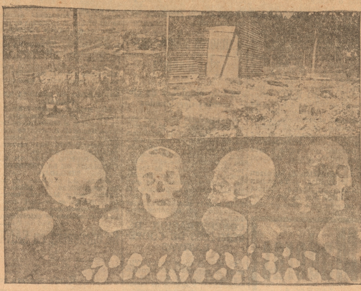
1).— Vista parcial de la escavación en que se hallaron los esqueletos de indígenas primitivos.— 2).— Vista panorámica del conchal.— 3).— Cráneos y armas de piedras halladas en las escavaciones.

Interrogamos también al señor Oliver sobre qué relación tenía este conchal y las numerosas investigaciones arqueológicas que hace años viene realizando en la provincia, y nos