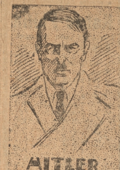
HINDENBURG O HITLER

Toda la política alemana parece encaminarse hacia un nacionalismo extremo y de combate. Los nacionalistas indican que