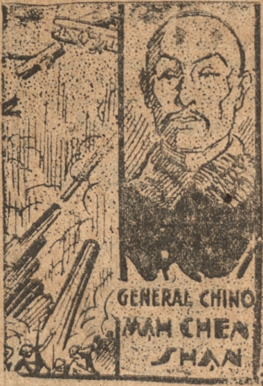
EL CONFLICTO EN EL ORIENTE

Los acontecimientos del conflicto chino-japonés se desarrollaron en relativa calma en el primer día de la semana.