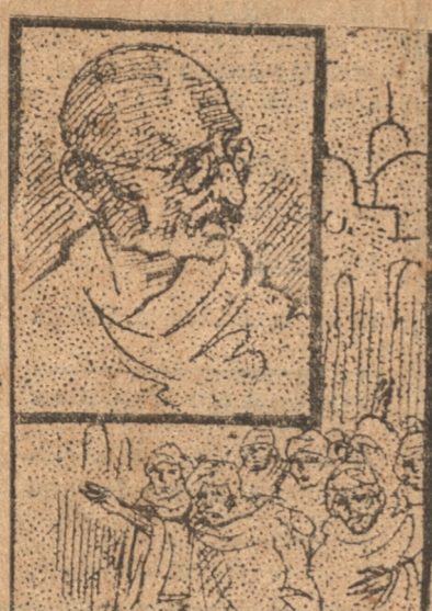
LOS VIOLENTOS SUCCESOS DE LA INDIA

En la cárcel de Yerovna en Poona, se encuentra encerrado el líder Mahatma Gandhi. Entre las cuatro paredes de su prisión permanece tranquilamente leyendo las telas para sus vestidos y bebiendo té de cábr con la impasibilidad que le caracteriza.