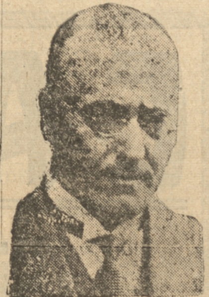
El Canciller de Alemania HERR BRUENING, que ayer declaró que Alemania no podía pagar más reparaciones

BERLIN, 9.— (U. P.) — El Canciller Herr Brüning declaró a la prensa que Alemania no podía continuar pagando las reparaciones. Refiriéndose a la próxima Conferencia de Lausanne, dijo: "Es igualmente claro que cualquier tentativa para mantener el sistema de pago de las deudas políticas llevará, no solamente a Alemania, sino a todo el mundo, al desastre".