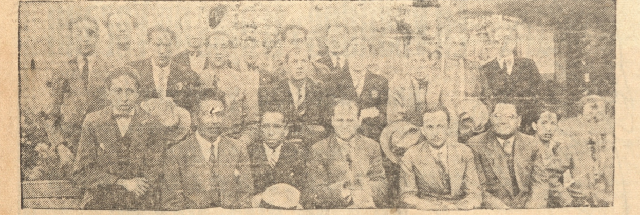
LOS PROFESORES Y ALUMNOS DEL LICEO DE LOS ANGELES POCO DESPUES DE REGRESAR A NUESTR A CIUDAD DE SU VIAJE A LOTA