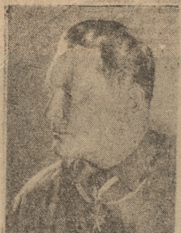
El general GOERING, se casó ayer con una artista de teatro en Berlín.

BERLIN, 10. — (UP.) — El Ministro del Reich y Jefe de los Servicios de Aviación general Hermann Goering y la artista de teatro Emma Soulemans contrajeron matrimonio en el Palacio Municipal a medio día. Poco antes de medio día Herr Goering pasó a buscar a Hitler y al Ministro de Justicia de Prusia Herr Hans Kerrl a la Cancillería. El grupo se dirigió al Palacio Municipal en medio de cordones de camiserías, parda y de la gran multitud que los vivaba. Hitler y Herr Kerrl iban en el primer automóvil escoltados de un cuerpo de guardia, más atrás iba Herr Goering y su novia en un automóvil cubierto de flores.