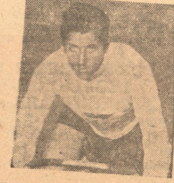
CARLIN de los rojos y crack local

exista entre ambos dos categorías de diferencia. Por accidente comprobado se perdonará una vuelta. Por accidente de uno de los dos corredores de un equipo, que dando imposibilitado para seguir corriendo no podrá ser reemplazado por otro, pudiendo su coequipo seguir corriendo siempre que queden, a lo máximo, dos llegadas para terminar la prueba. Podrán participar corredores de 4.ª y 1.ª categoría. El equipo que pierda cuatro vueltas deberá retirarse de la prueba. El club organizador no se hace responsable de los accidentes que se producen durante la carrera. Cada club participante deberá ir prevenido de su indispensable botiquín.