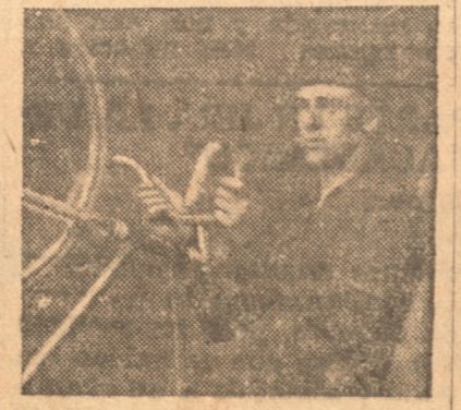
VEGA del Español que hace equipo con Carlin

Volvemos, nuevamente, por las tardes del ciclismo en la pista del Campo de Deportes de Español en el ex local del Club de Regatas Arturo Prat. Y la afición pedaletera comenta, se entrena y hace pronósticos sobre la gran carrera con que se inauguran estas actividades.