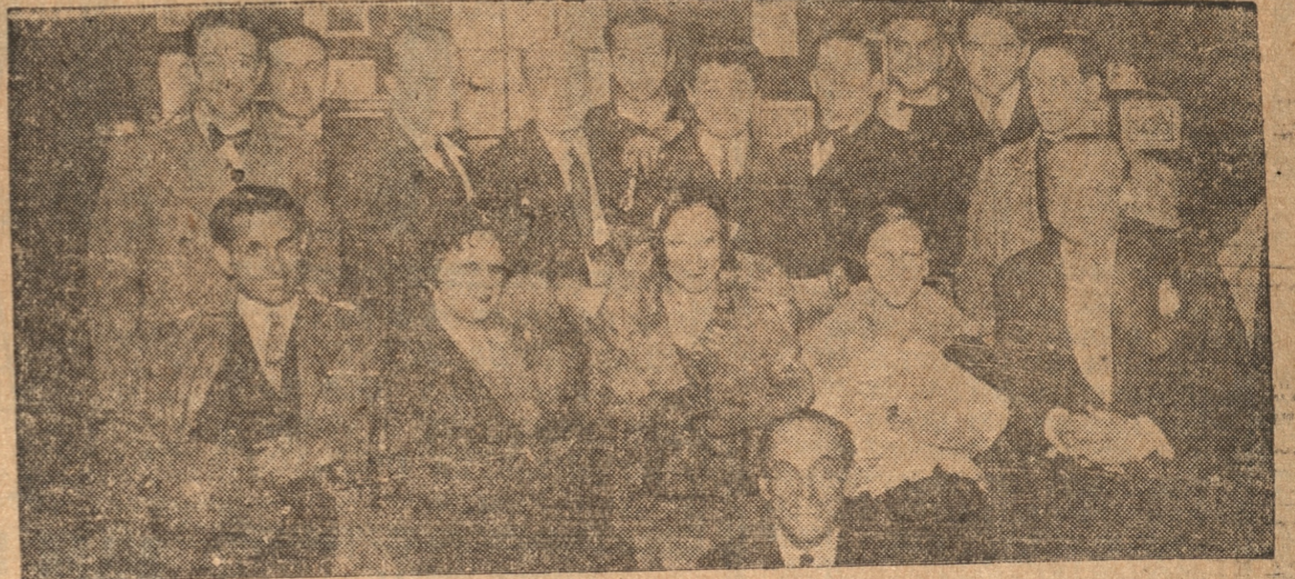
PRINCIPALES FIGURAS DEL CONJUNTO QUE ACTUA EN EL CONCEPCION EN SU VISITA A "LA PATRIA"