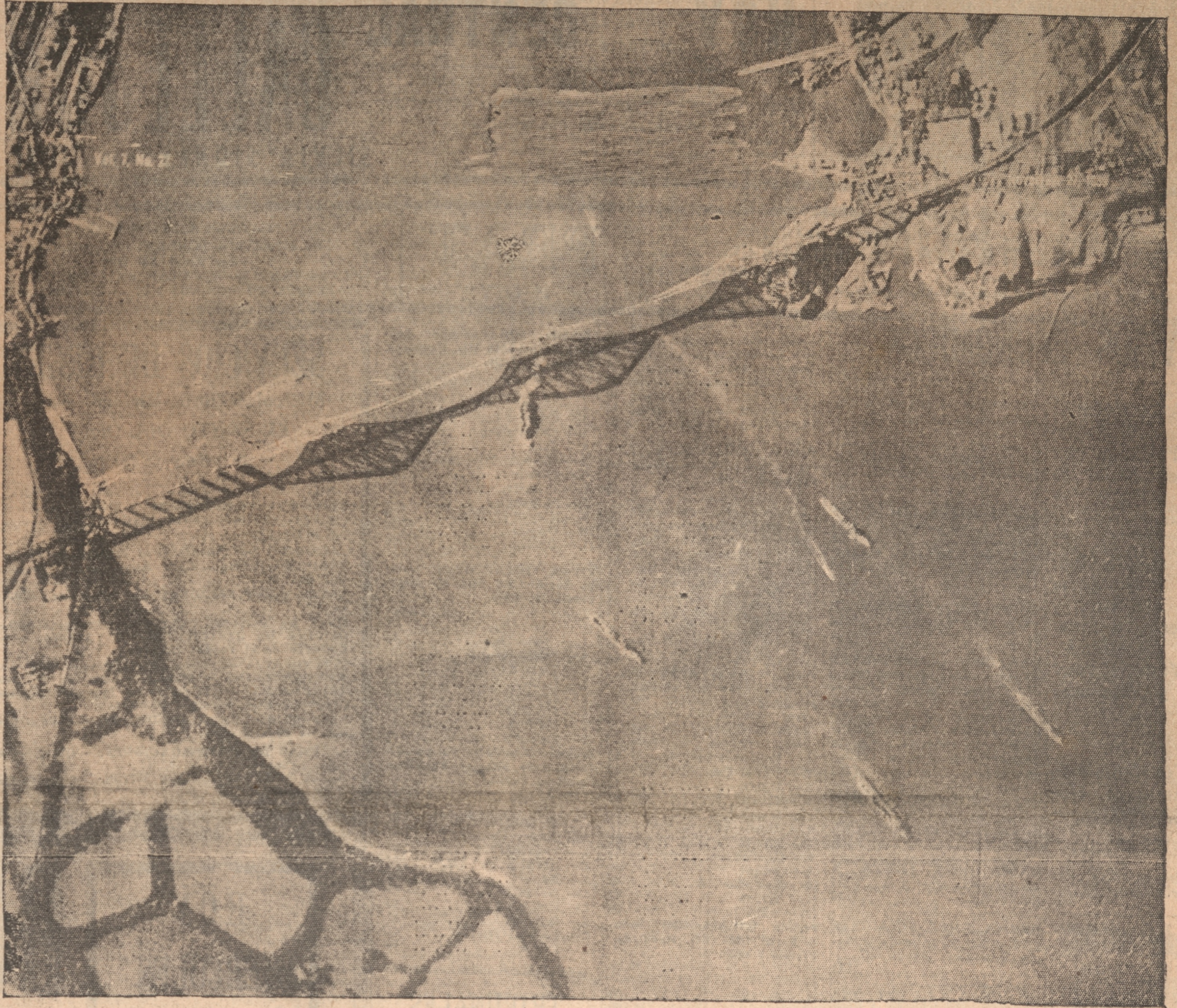
Esta admirable fotografía tomada desde un avión sobre el famoso Firth of Forth, permite ver el puente, uno de los más largos del mundo, y a un portavión y tres cruceros británicos.