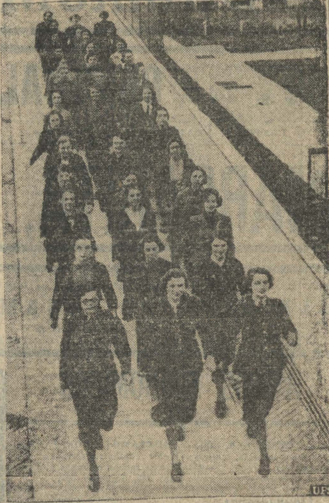
Estas mujeres inglesas que marchan marcialmente, aprenden a cocinar y se preparan para otros muchos trabajos con el objeto de servir como fuerzas auxiliares en Gran Bretaña. La fotografía fué tomada frente a un hotel que ha sido puesto a disposición del Servicio Auxiliar de Mujeres de Inglaterra.