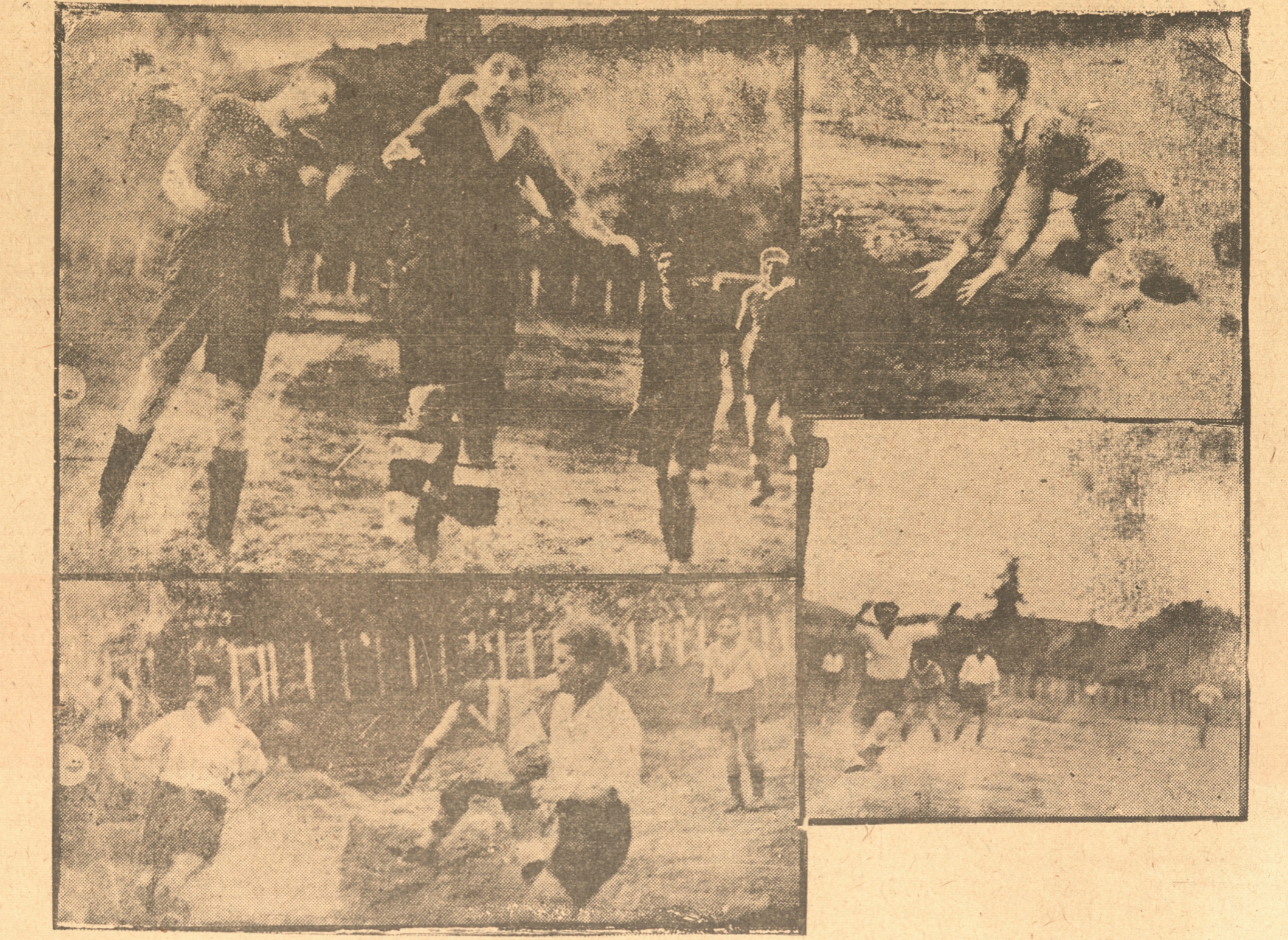
PRESENTAMOS UN INTERESANTE CONJUNTO DE FOTOGRAFIAS tomadas ayer por nuestro fotógrafo en la cancha Collao. — 1) El meta del Ferroviarios en duro trance ante un avance de los ágiles del Victoria de Chile. — 2) Los defensores del Victoria de Chile han cedido un corner y están alertas para alejar el peligro. — 3 y 4, dos interesantes fases del match entre el Palacios y el Coquimbo de Penco. — En ambas se vé la ciudadela del cuadro tocomeño en peligro