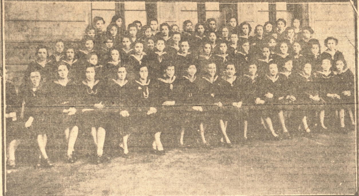
1) Hermoso edificio del Liceo — 2) Alumnas del 6.º año. — 3) Alumnas del 5.º año