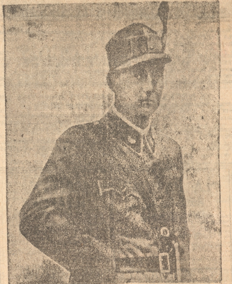
El Príncipe Ernst Rudinger von Starhemberg, que gestionará en Francia el aumento del efectivo de las fuerzas armadas de Austria

Se verificó esta noche en el teatro Municipal, ante enorme concurrencia, la velada organizada por la sociedad de Santiago en homenaje a los carabineros que actuaron en los sucesos del Alto Bío-Bío y en beneficio de las familias de los carabineros damnificados.