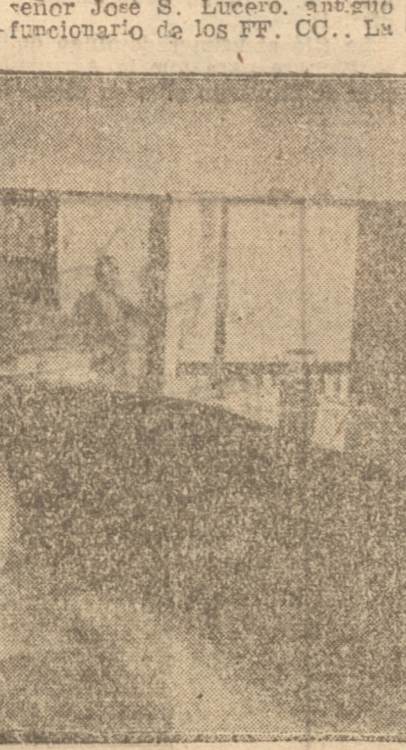
LA OFICINA DE INFORMACIONES DE LOS FF. CC. EN LA QUE FUNCIONA EL DEPTO MUNICIPAL DE TURISMO