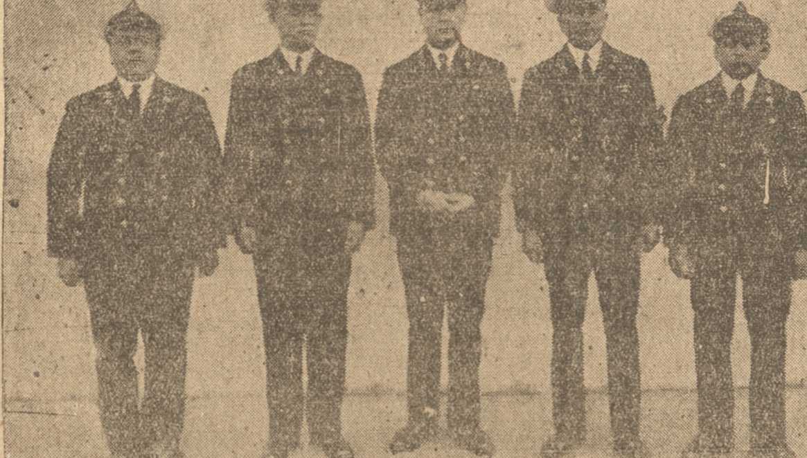
SUB-OFCIALES QUE HACEN EL CURSO PARA OPTAR AL GRADO DE OFICIAL DE MAR

15 horas.— Matinée ofrecida por el director, oficiales y tripulación de la Escuela a sus familias.