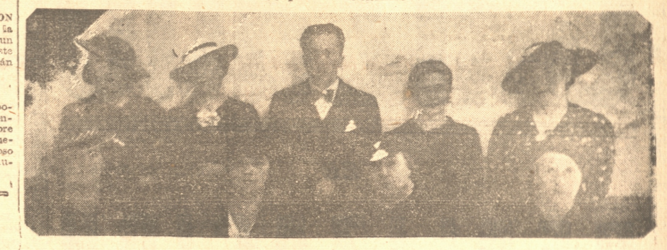
Asistentes a la manifestación a Rosita Renard

Brillantemente se dió término al curso de perfeccionamiento de la eminente concertista Rosita Renard. — Manifestación ofrecida con este motivo por sus alumnos