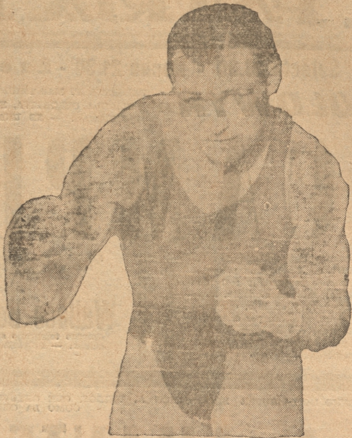
SCHARKEY, nuevo campeón mundial de gran peso

Jack Sharkey, que es en la actualidad rico y posee una suntuosa villa en Chesnut-Hill, luchó en los comienzos de su carrera con grandes dificultades. Muy joven todavía se vio obligado a ganarse la vida, primero, como criado en un circo, luego, como fogonero de ferrocarriles. Su sueño de la infancia, ser marino, no se realizó hasta muchos años después. Se