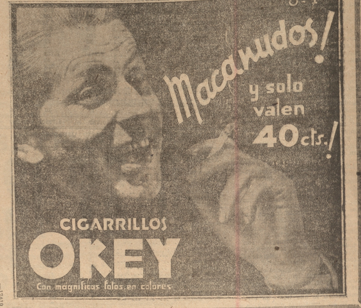
CIGARRILLOS OKEY Con magníficas fotos en colores