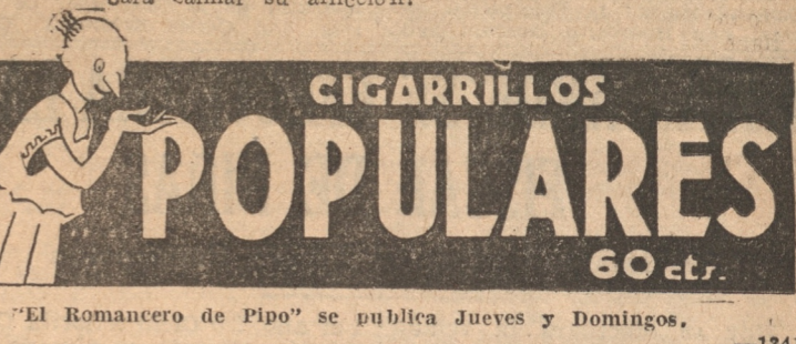
"El Romancero de Pipo" se publica Jueves y Domingos.

Y en razón de llorar tanto, calman ansias seculares de la humana condición: Todo el mundo suelta el llanto si no tiene POPULAR para calmar su aflicción!