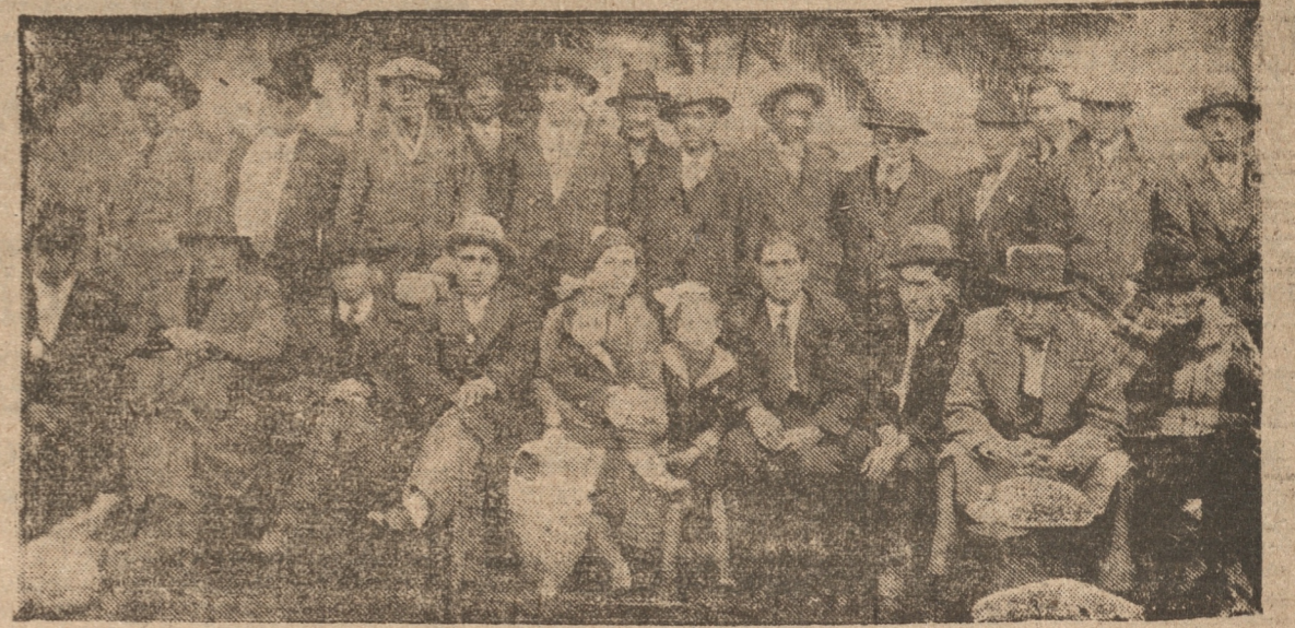
UNA FOTO DE LOS PLAYERS SUREÑOS A SU LLEGADA, AYER, A LA ESTACION CENTRAL DE CONCEPCION

FUE GRANDIOSO EL RECIBIMIENTO QUE TRIBUTO EL PUEBLO DE LOTA A SUS CAMPEONES. — SALVAS, FUEGOS ARTIFICIALES Y RECEPCIONES. — EL BANQUETE DE HOY-SU PASADA AYER POR CONCEPCION. — LO QUE DIJERON JUGADORES Y DIRIGENTES A "LA PATRIA". — AGRADECIMIENTOS PARA CON ESTE DIARIO. — OTROS DATOS