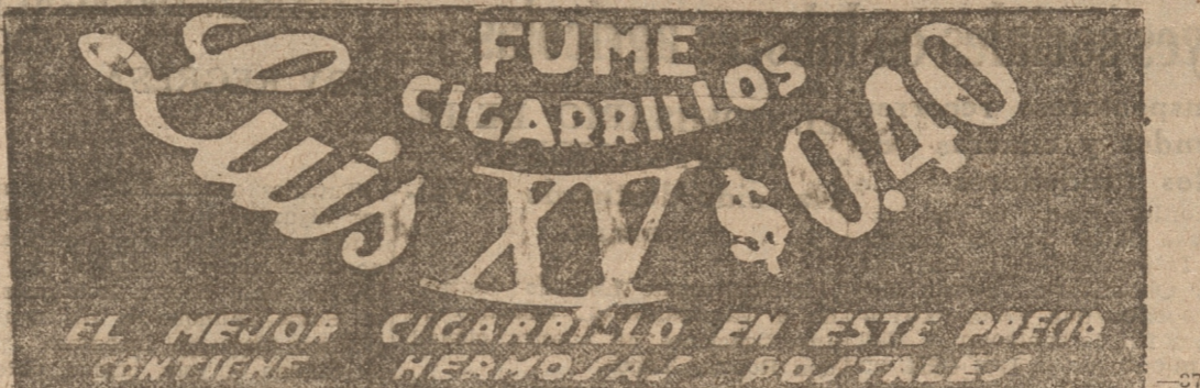
EL MEJOR CIGARRILLO EN ESTE PRECIO CONTIENE HERMOJAL, ADITIVO