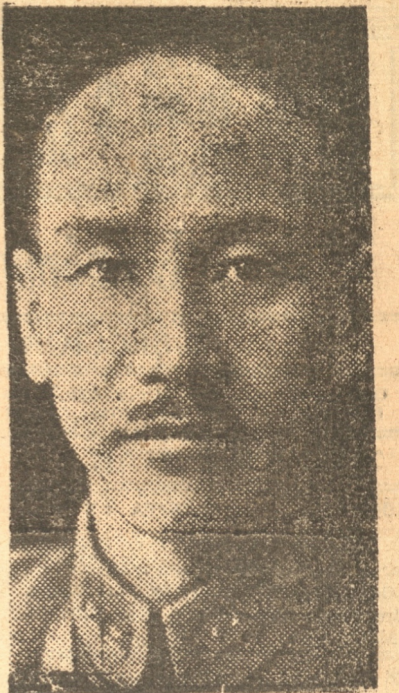
Generalísimo CHIANG KAI SHEK

SHANGHAI, 24. — (U. P.). — El corresponsal de la Agencia Central de Noticias en Hankow, comunica que trece aeroplanos japoneses bombardearon el puerto fluvial a las 17.20 horas matando a una gran cantidad de habitantes. Un caño chino con artillería anti-aérea fue blanco del bombardeo de los aparatos imperiales. Las bombas también cayeron en la zona de la ribera demoliendo una gran cantidad de edificios.