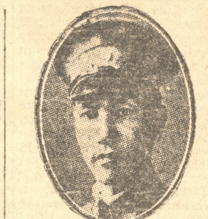
Mariscal Chiang Kay Shek, que renunció a la presidencia del gobierno nacionalista chino

El mariscal Chiang Kay Shek se dirigió a su villa en las termas de Tansham, cerca de esta ciudad.