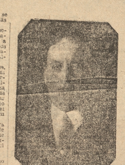
DON EDUARDO SCHUYLER

Señalamos que nos agrega el señor Alcalde, una de sus preocupaciones, ayudar en forma efectiva a los cesantes y dentro de los medios que le sea posible, como medidas de la comuna frente a la Alcaldía.