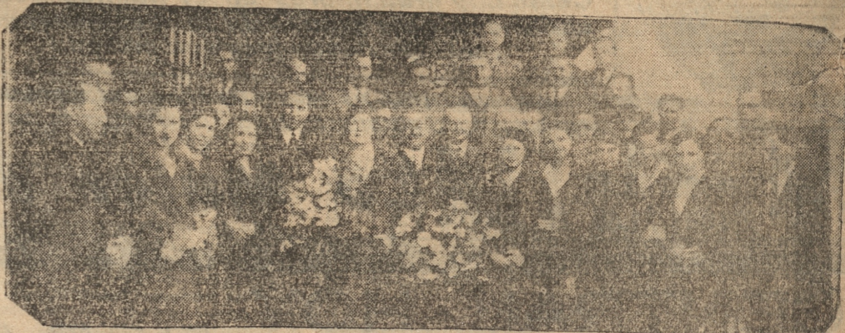
SEÑORITAS DE LOTA Y MIEMBROS DE LA COMITIVA DEL MINISTRO

de la ciudad con el objeto de iniciar las visitas a las obras públicas e inconclusas y a las que deben iniciarse a la brevedad posi-