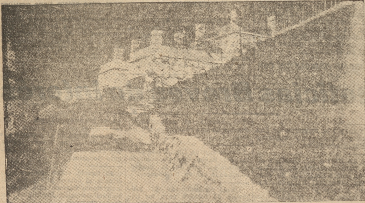
UN HERMOSO PASO EN EL CERRO CARACOL

de los materiales existentes; así las gradas provienen de las es-